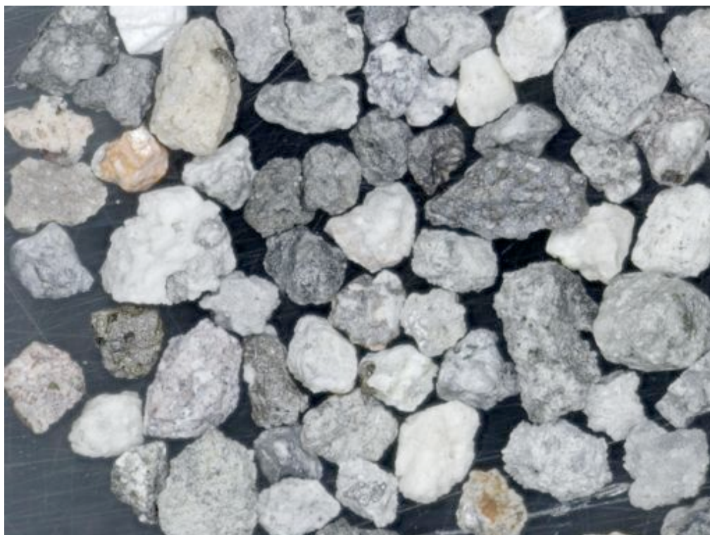
写真 1 : A 粒子グループ. 粒径 1-0.5mm. 様々な程度に変質・風化等の二次作用を受けた岩片および結晶片で 60.5 重量%と大半を占める.