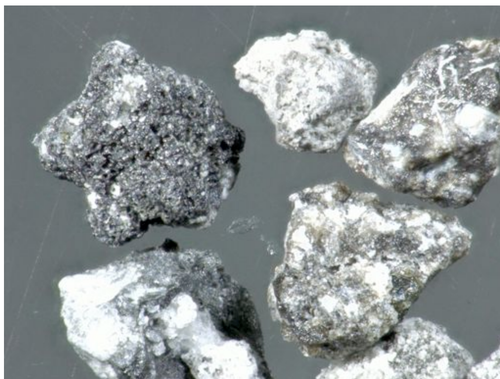
写真 6 : W 粒子グループ(拡大). 粒径 1-0.5mm.