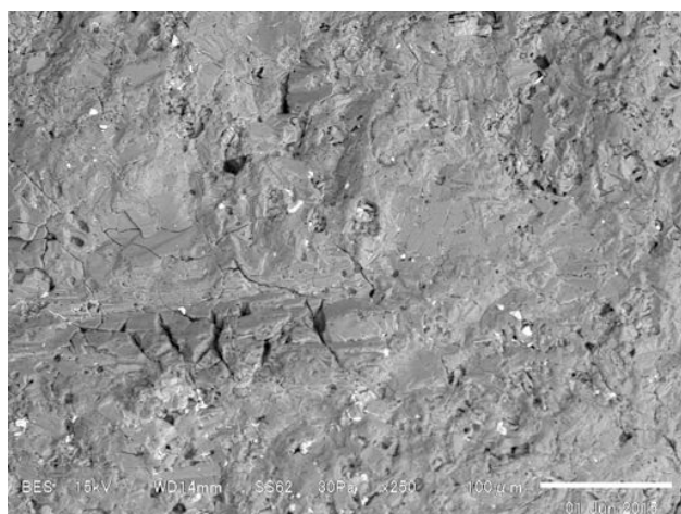
写真8 走査型電子顕微鏡画像. G グループ粒子の表面に特徴的にみられる、急冷クラックと考えられる網状の微細クラック.