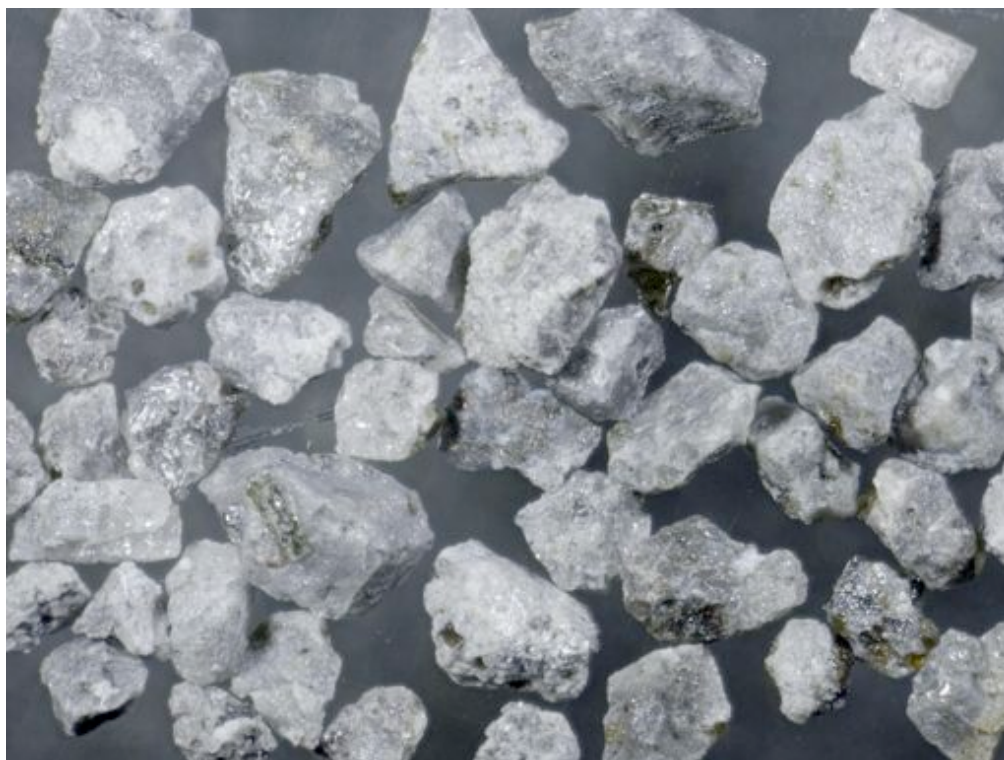
写真3：G粒子グループ。粒径1-0.5mm。2014年8月3日噴出物に10%以下含まれた新鮮でガラス光沢をもつ粒子(2014.8.7報告済)と同じ特徴の粒子で29.2重量%を占める。