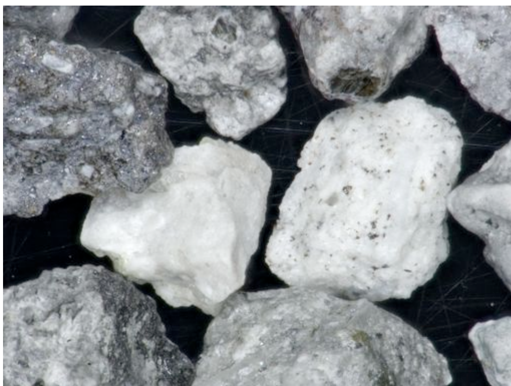
写真 2 : A 粒子グループ(拡大). 粒径 1-0.5mm.