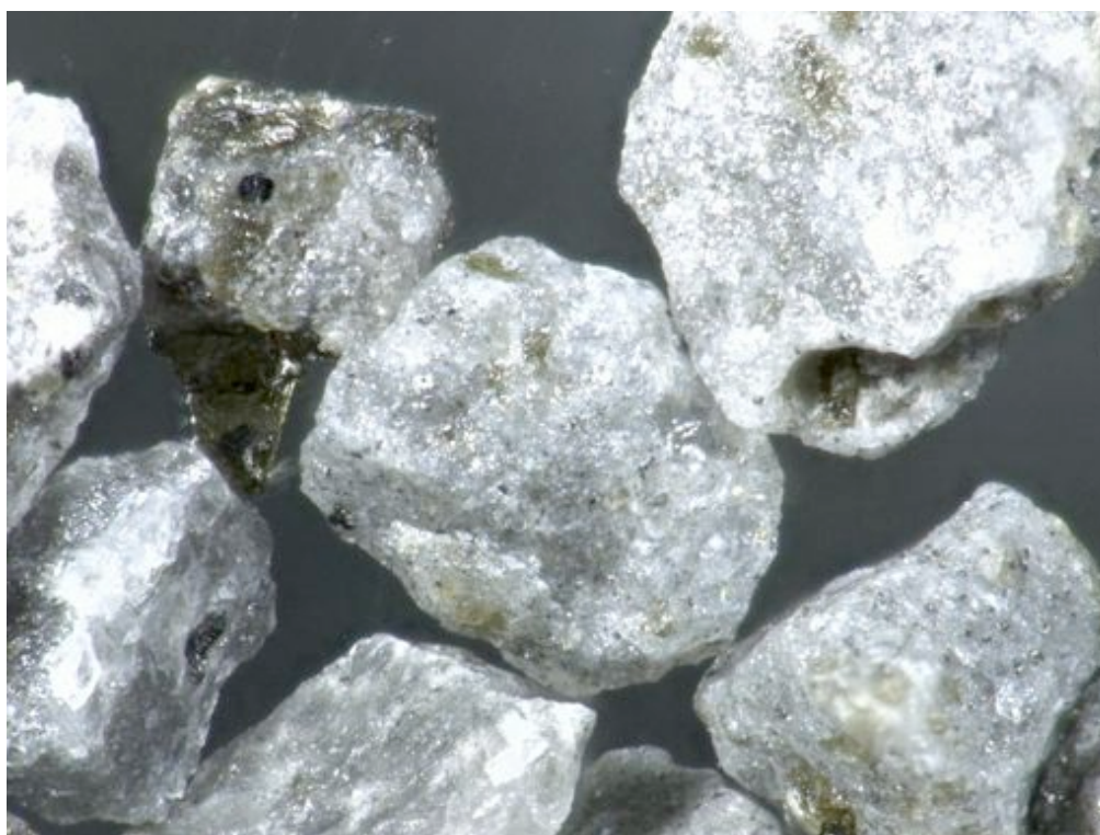
写真4：G粒子グループ(拡大)。粒径1-0.5mm。