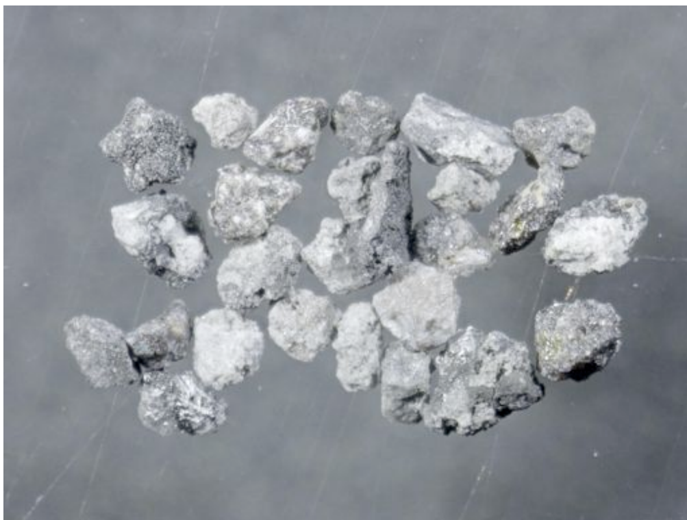
写真 5 : W 粒子グループ. 粒径 1-0.5mm. A と G 以外の粒子であり 10.2 重量%を占める.