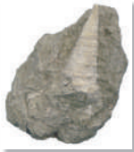
新生代 巻貝(ビカリヤ)