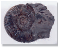
中生代 アンモナイト