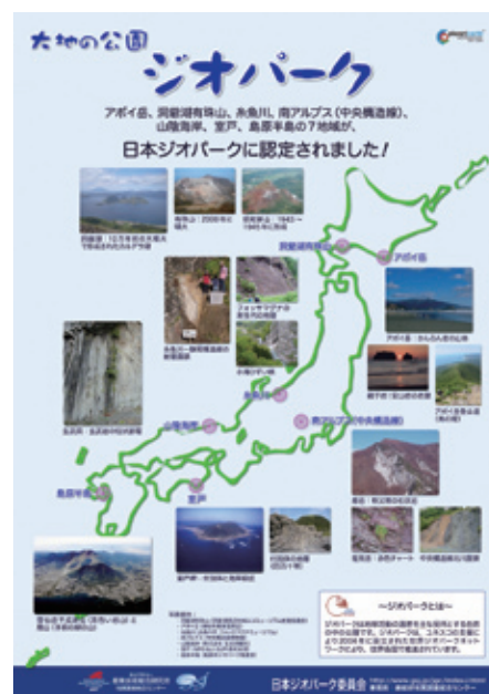
写真 ジオパークのポスター。

また, 12月25日に, 洞爺湖・有珠山, 糸魚川, 島原半島の3地域のGGN加盟申請書を, JGC