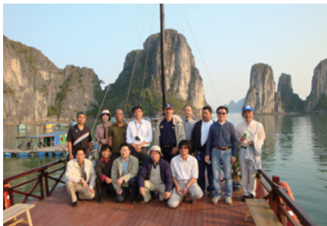
写真2 ハロン湾の船上にて(12/11撮影)。