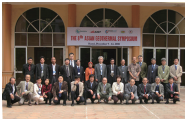
写真1 シンポジウム会場前にて、参加者の集合写真(12/10撮影)。

今回は講演会、巡検ともに、招聘者以外の参加者が前回までより大幅に増えている。アジア地熱シンポジウムは、第4回まではNEDO主催、第5回以降は地圏資源環境研究部門が主催しており、継続してきた意義が改めて示されたようだ。また、本シンポジウムの案内を掲示してくれたCCOP、国際地熱協会(International Geothermal Association)の両組織に謝意を表したい。