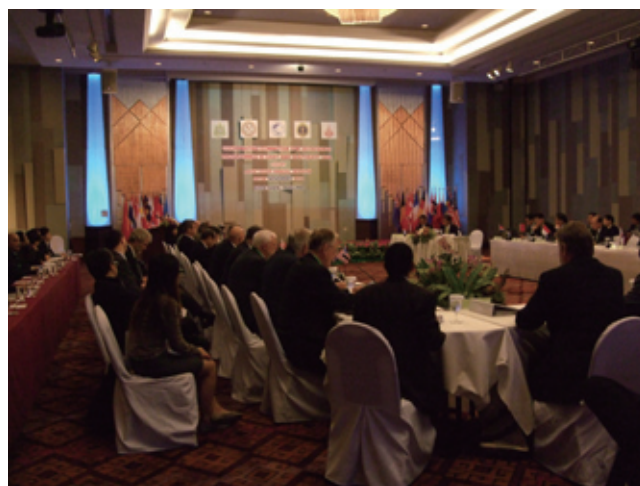
写真1 総会会場の様子。

その他の報告として、CCOPにおけるIYPE(国連国際惑星地球年)活動の一環として行われた単行本”Geoheritage in East and Southeast Asia”が発刊されたこと、続編としてCCOP域内の地質博物館(Geological Museum)に関する出版を計画していることが報告されました。新協力国としてフィンランドが加わったこと、東チモールから加盟に関する同意書(letter of intent)が付託されたことが報告されました。フィンランドの加盟については、加藤代表から歓迎の辞があり、フィンランド地質調査所(GTK)のEkdahl所長から挨拶がありました。ベトナム代表団から、2009年CCOP年次総会開催地ベトナムのブンタオについて紹介がなされました。