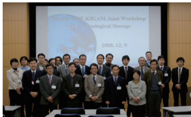
写真 会場での記念撮影。

個々の発表後の質疑応答や総合討論では、研究の内容や進捗状況、今後の展開に関して活発な議論が行われました。特にモニタリング手法に関しては、実際の適用を念頭にした意見交換が行われ、参加者の関心の高さが示されました。最後に第2回合同ワークショップを来年度に韓国で実施することが決まり、両機関の協力関係が改めて確認されました。