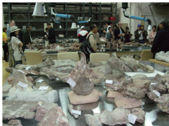
写真2 シリントン恐竜博物館の化石研究室。