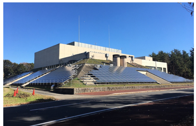
写真 1 エネルギーセンター。現在は倉庫として使われている。2018 年撮影。

で集中管理するので，部屋ごとの個別空調機器は不要なのでストーブや扇風機は持っていかなくてよいので破棄せよとお達しがあった。したがって帳簿からそれらの備品番号は削除されたが，廃棄されるべき物品そのものはかまわず引っ越し荷物に紛れさせて持って行った人が多くいた。結果的にこのほうが正解であった。17：30 頃になるとエネルギーセンターは供給を停止し，全館一斉にエアコンが止ってしまったのである。はめ込みやそれに近い作りの窓を持つ部屋は暑さにいたたまれなかった。一方，霞が関でも当時から省エネということで，冷房は 7 月 15 日 - 9 月 15 日の 27℃ 以上の日のみ入れる決まりであった。当然その前後でも気温が高い日はあったわけで，新庁舎の窓もろくに開かない環境では仕事も何もあったものではなかった。筆者が後述のように霞が関の工業技術院（工技院）併任時に 7 月上旬の期限前であるにもかかわらず，冷房が入ったので喜んだことがあった。聞くと「試験運転」という名目で冷房を入れたという。また，9 月下旬の暑い日に