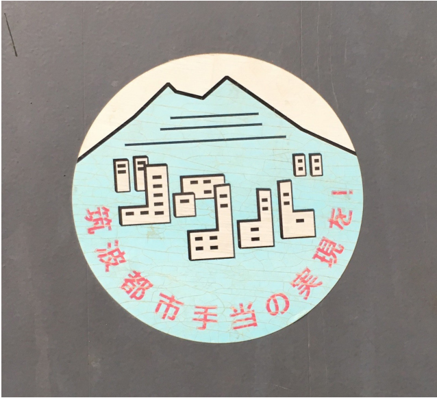
写真2 今も所内に残るステッカー。直径約10cm。2018年撮影。

心に反対し、即廃止ではなく廃止に伴う経過措置として「暫定筑波研究学園都市移転手当」が一定期間、特定試験研究機関に支給されることになりかけた。ところが、どういふわけか筑波に所在する工技院傘下の研究所のうち地質調査所と計量研究所を除くというのである。定かではないが、支給する官庁側にしても、反対運動で全面的に経過措置をつけるのはメンツをつぶされるに等しく、なんとか値切ろうと模索したのであろう。他研究所は「技術研究所」という名称が入っており、前述の「鉱工業の科学技術に関する研究及び開発並びにこれらに関連する業務を行うこと。」という目的に合致しているが、2号・3号業務はその限りではないという屁理屈を持ち出したわけである。地質調査所側も全体が一斉に廃止されるなら納得はできないがある程度の理解はできるとしても、蚊帳の外に押し出されることを肯んじることはできなかった。どうやら「調査所」というのは「研究所」ではなく、ルーチンワークをこなすだけの所と見くびられたらしい。