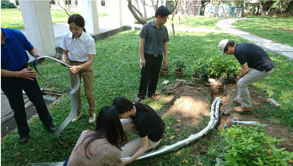
写真2 既設の熱交換器と熱応答試験機を配管接続.