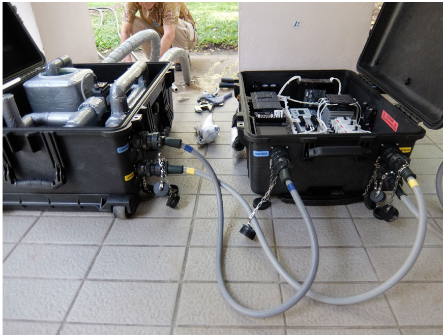
写真3 熱応答試験の実施風景. 左は循環ポンプ装置, 右は制御関係の装置.