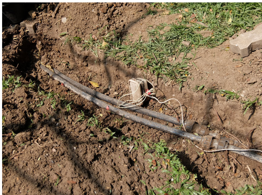
写真1 既設の熱交換器の配管を掘り起こす.

タとして利用されます。地中熱交換器から得られる熱交換量は、地質や地下水流動状況によって大きく異なります。日本国内において居住地域の多くを占める平野部では、地層の不均質性が大きく、また熱交換能力に大きな影響を与える地下水の存在も局所的な推定は容易ではありません。したがって、熱応答試験によって事前に熱交換量を推定することは、地中熱利用システムの採算性向上に極めて重要です(地中熱利用促進協会, 2014)。