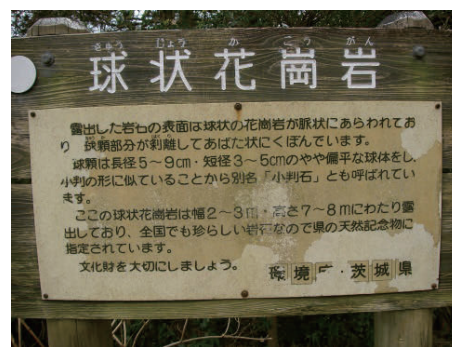
写真8 ⑭「球状花崗岩」 (県指定 天然記念物)