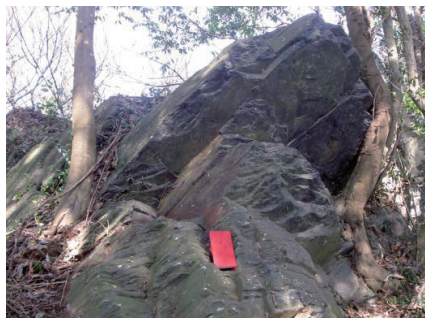
写真1 染谷の波付岩(雲母片岩)