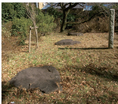
写真4 ⑨常陸国分寺講堂跡の礎石 (斑れい岩類)