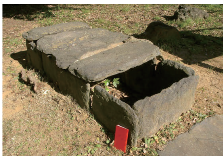
写真2 ⑤舟塚山9号墳の石棺(雲母片岩) ふるさと歴史館に復元・保存