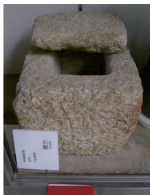
写真7 「経筒石櫃付」(花崗岩) (県指定 考古資料)