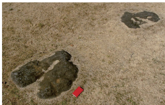
写真5 ⑩常陸国分尼寺中門跡の礎石 (斑れい岩類)