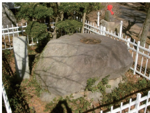
写真6 ⑨常陸国分寺跡にある塔心礎 (斑れい岩類)