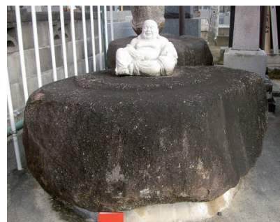
写真3 ⑧茨城廃寺の礎石(花崗岩) (市指定 考古資料, 清涼寺)