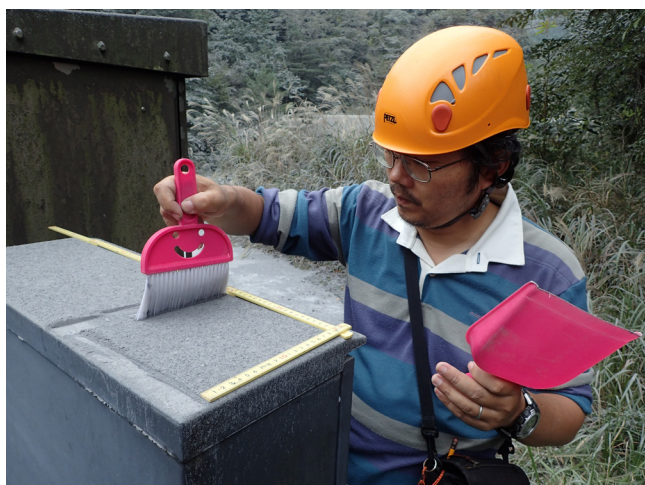
写真6 火山灰調査風景。上空の開けた場所で、通過する車の風の影響を受けない水平面を選び、一定面積内で火山灰を回収する(高原町)。乾燥している場合はその夜のうちに重量を測定(10月13日午後)。