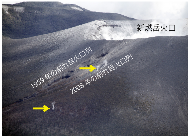
写真4 火口西側の噴気(10月13日午前)。新燃岳火口の西斜面に形成された割れ目火口列付近から上がる噴気(黄色の矢印2ヶ所)。中央の噴気は2008年噴火で形成された小規模な割れ目火口から上がっている。