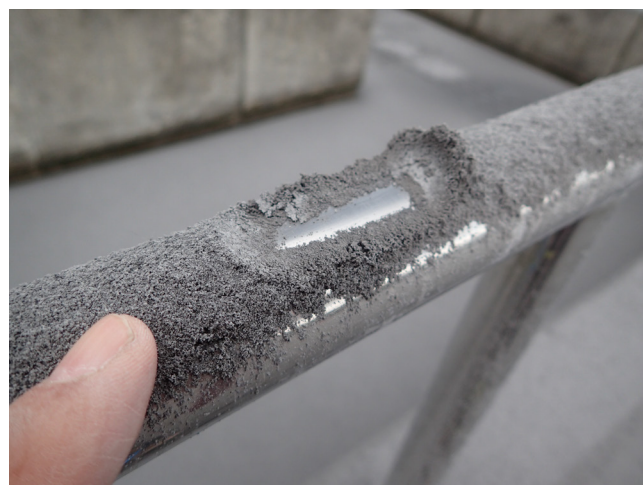
写真8 新燃岳火口北東側、夷守台キャンプ場管理棟の手すり到此の日の朝から積もった火山灰(10月14日午前)。まだ雨はそれほど激しくなっていないが、火山灰交じりの泥雨も降った。