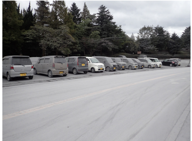
写真11 15日からの噴火では風向きが変わり、新燃岳西側の霧島温泉郷でも降灰で温泉街が灰色になった。センターラインがほとんど見えなくなり、多くの車は火山灰をかぶっている(10月16日午前)。