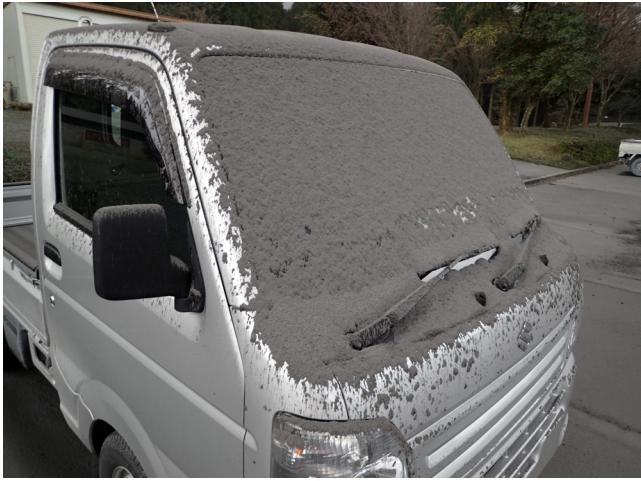
写真9 夷守台キャンプ場に朝から出勤してきた職員の車(10月14日午前).