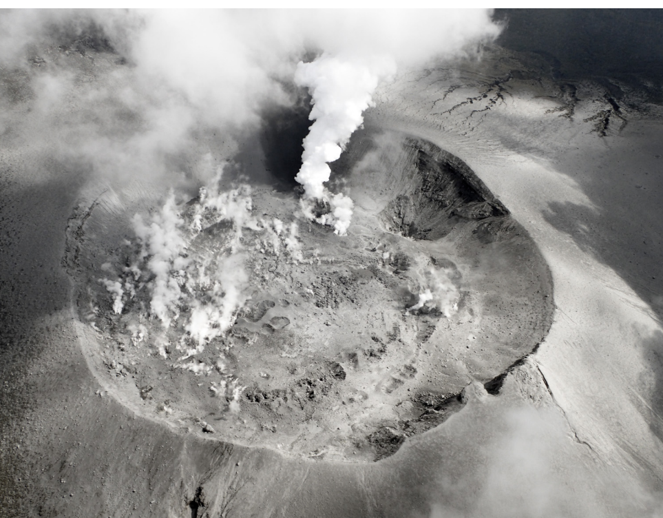
写真3 西側上空から見た新燃岳火口(10月13日午前)。前日(表紙, 写真2)とは異なりこの日は白色噴煙で、火孔から火山灰はほとんど放出されていない。火口周辺に新しい噴石の落下痕(インパクトクレーター)は確認されず、今回の噴火では細粒の火山灰のみが放出されたようだ。東(写真上)から北(写真左)にかけて火口内では噴気が上がる。噴火開始の11日から火口内の窪地には水たまりも確認されている。

今回の噴出物は細粒の火山灰のみです(写真5)。火口周辺でも新しい噴石放出の形跡はありません。降灰調査は先に現地入りしていた東京大学地震研究所や防災科学技術研究所のチームなどと連携し、各機関の調査データを合わせて全体の噴出量を計算することになります。できるだけ多くの地点で火山灰量を計測し、降下火山灰の等重量線を作成するには連携した調査が不可欠です。噴火が数日間、断続的に継続し、その間に西風が吹いたり東風が吹いたり、風向きが変化したので、広い範囲での調査が必要となりました。また、14日以降は雨模様になり、火山灰が雨に流されてしまうようになり、火山灰調査もかなり困難になりました。各機関の調査データが加わるごとに計算結果が