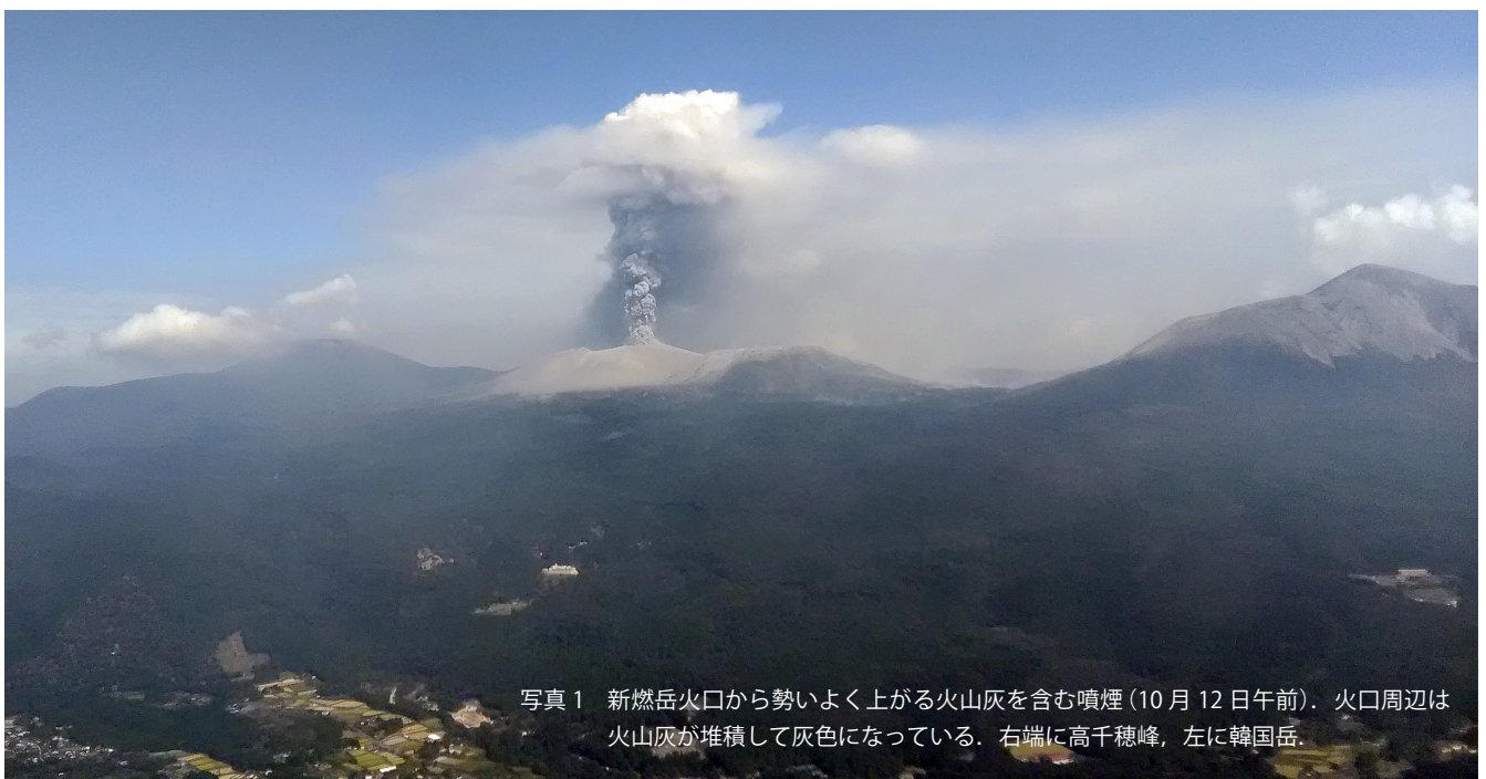
写真1 新燃岳火口から勢いよく上がる火山灰を含む噴煙(10月12日午前)。火口周辺は火山灰が堆積して灰色になっている。右端に高千穂峰、左に韓国岳。