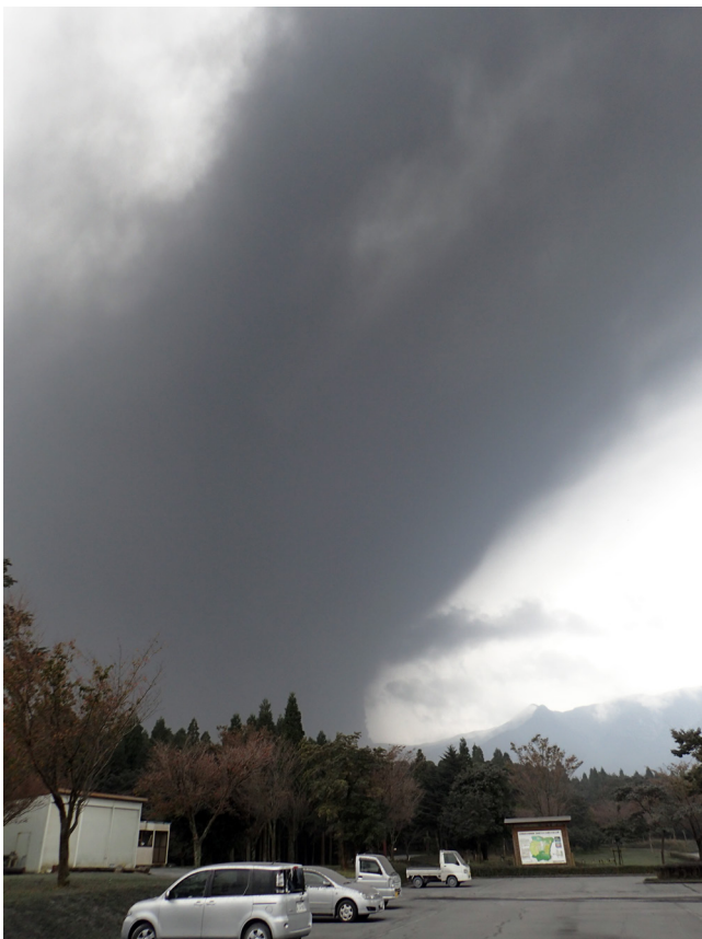
写真10 夷守台キャンプ場から見た10月14日昼頃の噴煙。ここは風下側にあたり大量の火山灰が降っており、耳を澄ますと火口方面からゴロゴロと鳴動も聞こえた。

に聞こえました。キャンプ場職員によると当日の朝方は鳴動だけでなく空振も強かったそうです。15日以降は西側のえびの高原から霧島温泉郷(写真11)にかけて降灰がありましたが、調査範囲内で降灰量の多いところでは1 m 2 あたり2 kgを超えています。今後の噴火に備え、火口東側に合計3ヶ所(夷守台、 おうじぼる 皇子原公園、 みいけ 御池付近)、火山灰採集バケツ(定点)を設置しました。