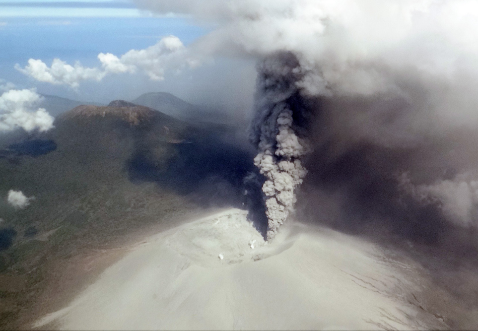
写真2 新燃岳火口東縁付近に形成された火孔から勢いよく上がる灰色噴煙(10月12日午前)。左奥に韓国岳。