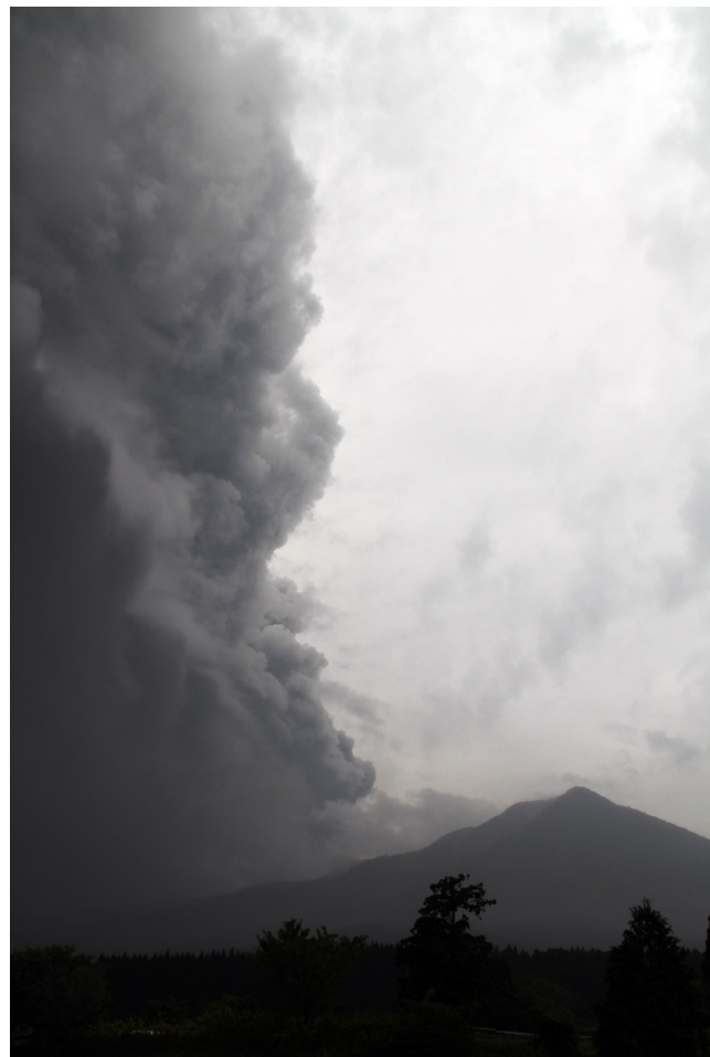
写真7 新燃岳北東、小林インターチェンジ南方より見た10月14日午前の噴煙。右手前の山は夷守岳。まもなく火山灰が降ってきた。