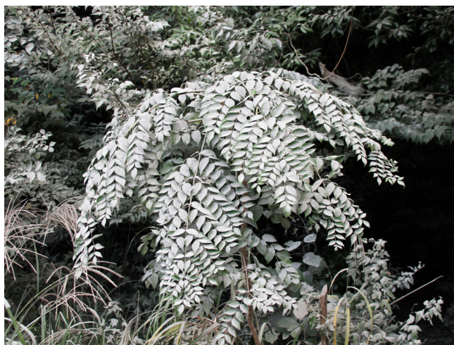
写真5 葉に積もる火山灰。緑色の葉にうっすらと灰色の火山灰が覆う。火口から5 kmほど離れており、風が吹けば舞い上がる(10月12日午後、小林市)。