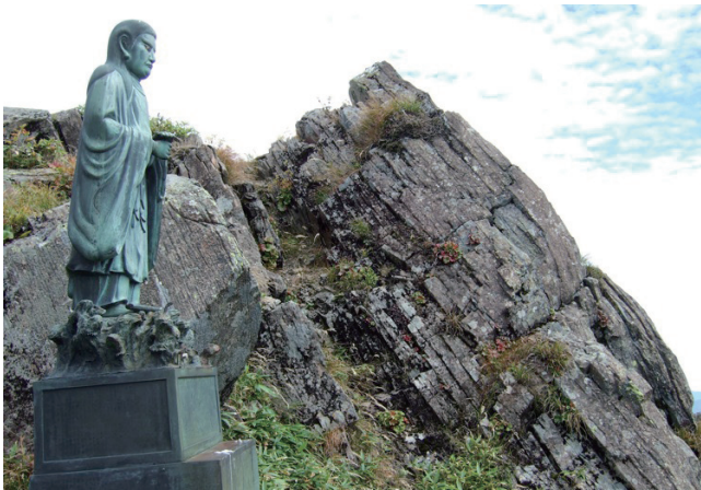
写真3 沖武尊山頂の板状節理の発達した安山岩溶岩と山名の由来となった日本武尊（やまとたけるのみこと）の銅像。

の孤立した山となっています。もともとの火山の原地形に近い場所は、北東の武尊田代付近や西の鹿俣山から玉原にかけて広がる緩斜面くらいではないでしょうか。この山を遠望すると、山頂付近にはほぼ水平な層が見えますが、こ