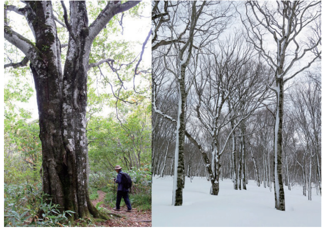
写真4 玉原高原付近のブナ林。夏（左写真）も冬（右写真）も気軽にブナ林を楽しむことができる。そのほかにアスナロ、タムシバやウリハダカエデなどの樹木のほか、湿原ではミズバショウやキンコウカなどの湿原性植物が多い。

の孤立した山となっています。もともとの火山の原地形に近い場所は、北東の武尊田代付近や西の鹿俣山から玉原にかけて広がる緩斜面くらいではないでしょうか。この山を遠望すると、山頂付近にはほぼ水平な層が見えますが、こ