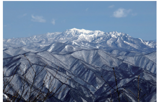
写真1 西南西、吾妻耶山より見る武尊山全景。山頂直下にほぼ水平な厚い溶岩層が見える。

さすが火山国，日本。百名山の約半数は第四紀の火山から構成されています。この武尊山もその1つです。この山は北アルプスの穂高岳と区別するために、上州（上野国 = ほぼ群馬県）に位置することから「上州武尊」と呼ばれることが多いようです。また、この山は標高が2,000 mを超すにもかかわらず、国立公園でも国定公園でも、また県立自然公園でもない極めて珍しい山で、このような山岳は百名山では唯一ではないでしょうか。また、周辺を谷川岳や至仏岳、赤城山、日光白根山などの名高い山々に囲まれ、百名山の中では知名度も人気度もわりと低い、不遇な山です。そもそも極めて難読な地名ですね。