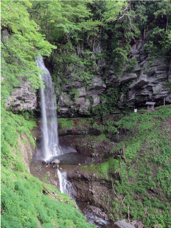
写真2 武尊山北西部に位置する裏見の滝。武尊火山から流れた厚い安山岩溶岩の層にかかる、落差約50mの直瀑。溶岩層には水平に近い板状節理が発達。硬い溶岩層が懸崖となって、下位の軟らかい火砕物層に滝壺ができています。