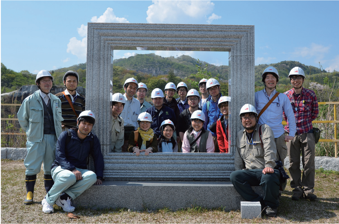
写真2 野外巡検の集合写真.

場の跡地を利用した「真壁トライアルランド」に到着しました。ここでは、2つの花崗岩体の貫入関係を観察しました。その後、筑波山を東側に見ながら筑波山梅林に移動して、筑波山を構成している斑れい岩の巨岩を観察しました。筑波山は山自体がご神体となっているということで、参加者が気持ちうやうやしく観察しているように見えたのは私だけでしょうか。