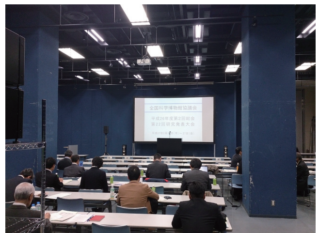
写真2 総会での意見交換の様子。