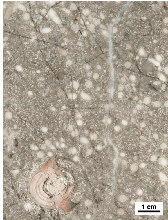
第5図 フズリナ類 (大型有孔虫) とアンモノイド類。当時の礁の内側にはフズリナなどが集積し、しばしば砂浜をつくっていた。フズリナ類は進化が速く、重要な示準化石として知られる。写真の石灰岩には、中期ペルム紀を示すフズリナ Parafusulina , Neoschwagerina がみられる。