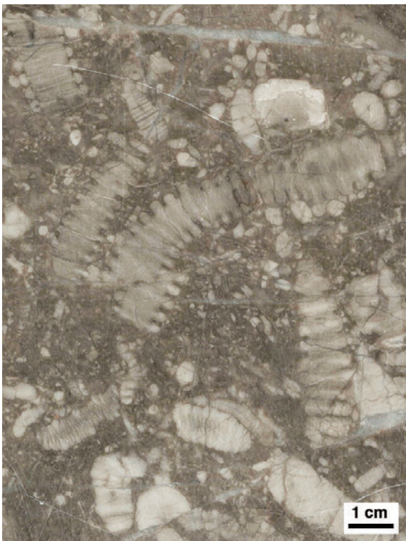
第6図 ウミユリを多く含む石灰岩。現在では深海に棲むウミユリも、石炭-ペルム紀には礁に多く生息していた。大量の遺骸片をつくり出すことから、浅海の堆積物供給者としても重要な役割を担っていた。写真のような半自生的な産状を示すものは、特に礁の前面に多くみられる。