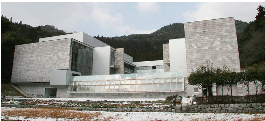
第1図 建築家 磯崎 新氏が設計した秋吉台国際芸術村の建築物。壁や床全体に地元の大理石石材「霞」が使用されている。

山口県美祢市に分布する秋吉石灰岩は、古生代石炭-ペルム紀に、超海洋パンサラッサの低緯度域の海洋島で形成された礁成の石灰岩である（佐野ほか，2009）。秋吉石灰岩は、明治期より大理石石材の採掘が行われ、国内では最大規模の大理石石材産地として知られてきた。大理石石材には熱変成で再結晶化した石灰岩が利用されることが多いが、一部には変成を受けていない初生組織が残された石灰岩も利用される。「霞」と称される大理石石材は、秋吉台の西部（西の台）で採掘される、造礁生物化石を多く含む、熱変成を受けていない石灰岩である。美祢市の秋吉台国際芸術村の建物には「霞」がふんだんに使用されており、研磨された石材の表面には、石炭-ペルム紀の礁を造った生物や礁に棲む生物の化石がたいへん良く観察される。ここではその代表的な生物を紹介する。