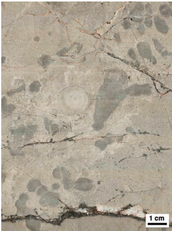
第2図 四射サンゴとその周りを被覆する海綿（ケーターテス類）や微生物類。後期石炭紀（ペンシルバニアン亜紀）の代表的な造礁生物群。海綿などがサンゴを被覆することで、波浪に耐えられる強固な礁構造をつくることのできた。