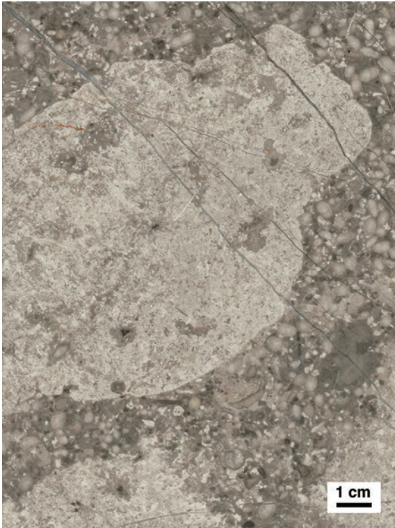
第4図 シアノバクテリアなどの微生物がつくる微生物岩 (microbialite) が礫として含まれる石灰岩。微生物類も礁をつくる生物として知られるが、気候期の転換時期 (氷室期→温室期) に相当する前期ペルム紀には、他の造礁生物が少なく、その一方で微生物岩が多産する。