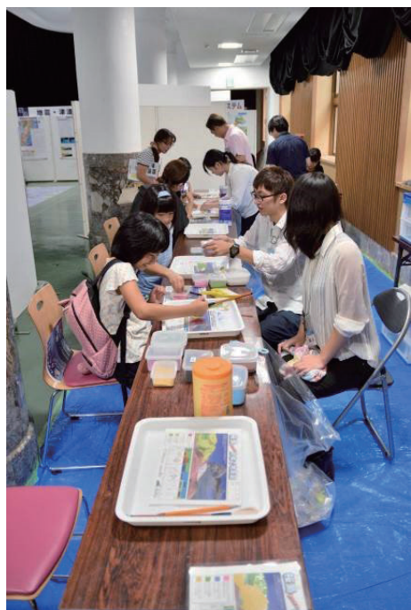
第4図 砂絵教材を用いた作業指導の様子。

年前に山頂から発生した武火砕流の堆積物（凡例Kt）、約4500年前から活発化した南岳の噴火による南岳主成層火山体（凡例M）、西暦1200年ごろに山頂もしくはその周辺で発生した噴火による中岳溶岩および火砕岩（凡例Nk）など。