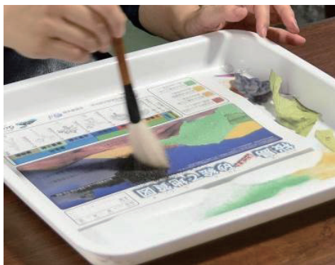
第3図 噴煙部分に火山灰を撒いて筆でならす様子。