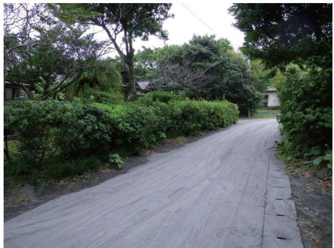
第2図 うっすらと火山灰が堆積した島内の道路。風向きによっては集落にも降灰します。

みで、海が荒れればそれも欠航します。諏訪之瀬島の島内は、集落が立地する島の最南端部以外ほとんどが急峻な山地で、自動車の走行できる道路は集落の周辺に限られています。また、登山道も島の南部から山頂までしか存在せず、それ以外はほとんど“人跡未踏”と言ってもよい状態です。