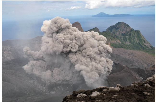
第1図 小噴火をする御岳火口。諏訪之瀬島御岳山頂から撮影。遠景は中之島。2009年11月撮影。

諏訪之瀬島は、長径約8.7 km、短径約4 km、標高796 mの小さな火山島です。行政単位としてはほかのトカラ列島の島々とともに、鹿児島県十島村に属します。諏訪之瀬島の人口は約60人で、そのおもな産業は観光と畜産（牛の飼育）です。諏訪之瀬島への交通は、週に2往復の村営フェリーが鹿児島と奄美大島の間を結んでいるの