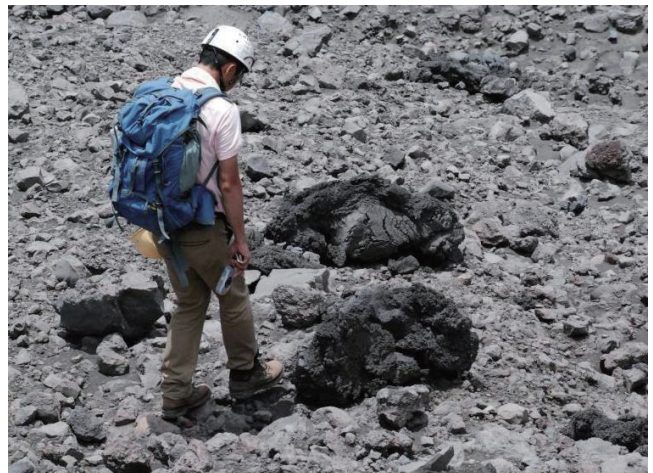
第4図 御岳山頂周辺には，爆発によって御岳火口から飛ばされた火山弾がみられます。この火山弾は2012年の活動によって飛ばされたマグマの破片で，ガラス光沢をもつ新鮮なパン皮状火山弾です。2013年7月撮影。

歴史記録が残る最も古い噴火は，1813年（文化10年）の大規模噴火です。火山地質図では，主に嶋野・小屋口（2001）による噴火推移の復元に従って，1813年噴火の推移や噴出物の分布を表しています。1813年噴火では，まず島の南山腹に火口が開き，そこから小規模な水蒸気噴火が起こり，少量の火山灰が噴出しました。やがて，噴火割れ目が次第に御岳山頂部に向かって拡大し，激しい割れ目噴火に移行しました。火口周辺に堆積した噴出物は，急峻な地形のために相次いで崩壊し，“火砕流”となって島の南部や東部，西部の海岸まで流下しました。火砕流は，噴火の終了まで繰り返し発生していたと考えられています。集落付近には，この火砕流堆積物が厚く堆積しています。また，集落付近に分布するこの火砕流堆積物には，しばしば直径10mを超える巨大な岩塊が含まれています。岩塊はアグルチネートと呼ばれる，まだ高温のスコリアが堆積して癒着した岩石からなり，火口周辺に急速に堆積した噴出物が高温の状態で崩壊し，火砕流となったものと考えられます。