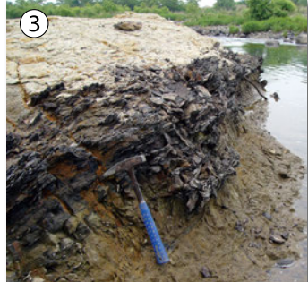
名取川下流に分布する亀岡層。亜炭層を挟む。