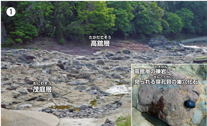
名取川中流に分布する高館層 (安山岩質-玄武岩質溶岩など) と茂庭層 (藤原ほか, 2013より引用)。