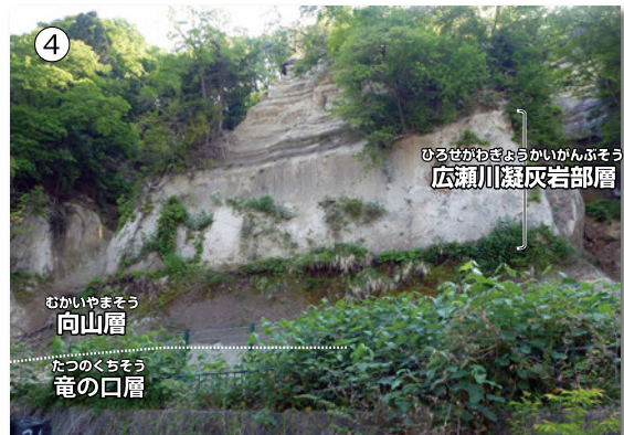
竜の口溪谷入り口付近に分布する竜の口層と向山層 (藤原ほか, 2013より引用)。