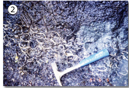
青葉山丘陵北方に分布する綱木層に挟まる貝化石層。