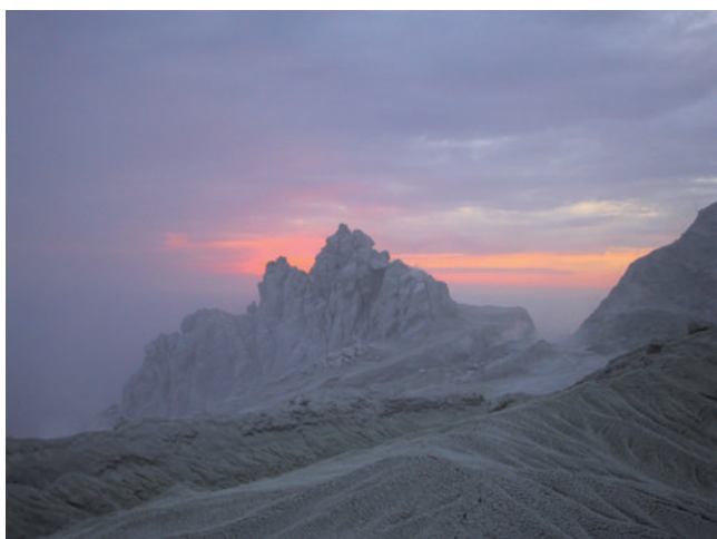
1. 入選「薩摩硫黄島(3) キンツバ火口の夕景」 西 祐司(産総研 地圏資源環境研究部門)