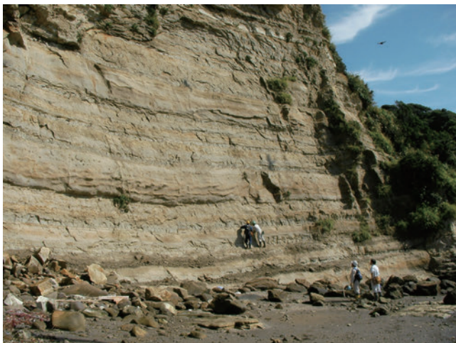
7. 入館者賞「タービダイト砂岩を覆う泥岩に2種類識別できるかな？—平成20年度地質調査研修（4泊5日）の記録10—」 徳橋秀一（産総研 地圏資源環境研究部門）