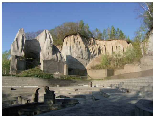
2. 入選「火山灰と石切場跡」 澤田結基(産総研 地質標本館)