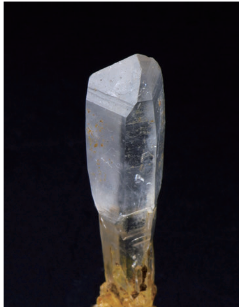
6. 入館者賞「土筆水晶（つくしすいしょう）」 井上裕貴（埼玉県越谷市立越谷小学校5年生）