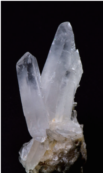
5. 入館者賞「『最後の砦』…水晶の群晶」 窪田真弓（茨城県立並木高等学校）