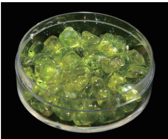
第1図 タンブル磨きしたペリドット。アメリカ、アリゾナ州産。容器の径約5 cm。