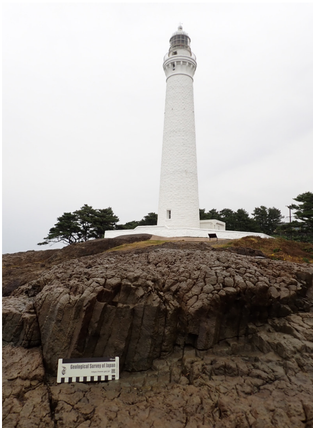
第 15 図 成相寺層の流紋岩溶岩に発達した柱状節理と日御岬灯台（10 月 31 日撮影）。柱状節理は柱の径が数 cm と特徴的に細い。