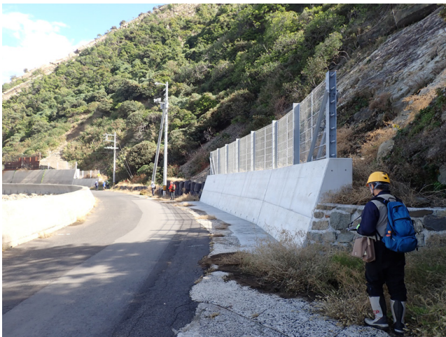
第7図 歩測によるルートマップ作成実習の様子(10月28日撮影)。クリノメーターで進行方向を確認し, 歩数から距離を算出してルートマップを描く作業を行った。