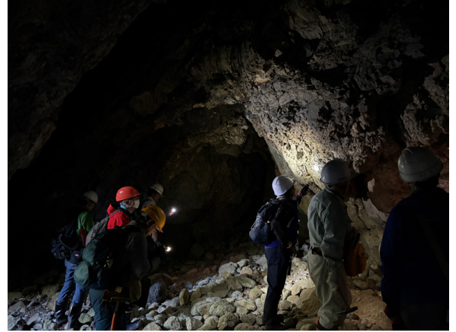
第 11 図 海蝕洞内部における成相寺層の流紋岩火砕岩の観察（10 月 29 日撮影）。入洞の際はヘッドライトを使用し、頭上に注意するなど、安全に十分配慮して観察を実施した。