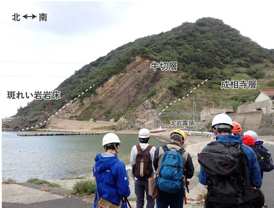
第3図 小伊津漁港（三浦）東部の海岸露頭（10月27日撮影）。岩相による露出状況の違いが確認できる。写真右側（南側）の下位は成相寺層の泥岩で、崩れやすいことから植生やコンクリートにより大部分が覆われている。研修では、写真中央やや右側の丸印地点で泥岩露頭を確認した。写真中央部の上位（北側）には、層理の明瞭な砂岩泥岩互層からなる牛切層が分布し、露頭北縁には斑れい岩の貫入岩が認められる。斑れい岩と牛切層の境界は牛切層の層理に調和的であることから、岩床（シル）と解釈される。