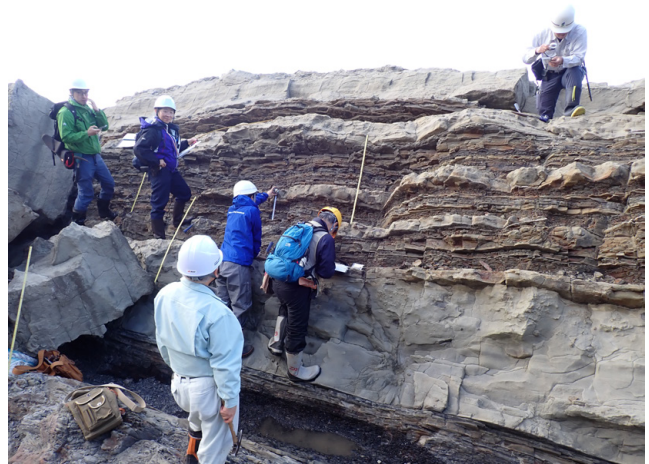
第8図 柱状図作成実習の様子(10月28日撮影)。牛切層の砂岩泥岩互層を対象に, 層厚約3m分の柱状図を作成した。

およびスランプ堆積物, 斑れい岩中の玉ねぎ状風化, 現成の崖錐堆積物, 露頭と崩壊岩塊の判別方法などについての説明・議論を行いました。