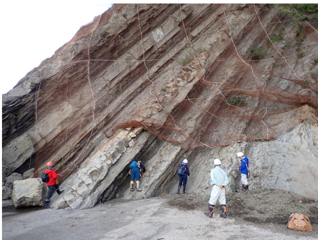
第4図 層理面の走向傾斜測定実習の様子（10月27日撮影）。参加者は各自で層理面の測定箇所を選定し、実測を行った。局所的な凹凸を避け、露頭を代表する層理面が露出した箇所を選ぶこと、磁石を引き寄せる金網から離れて測定することなどを指導した。測定後、参加者に結果を読み上げてもらい、各々の測定値を評価した。