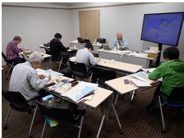
第 12 図 データ整理と岩相境界線の作図作業の様子 (10 月 29 日撮影)。製図用地図に各自のオリジナルデータを転記し、地層等高線などを書き入れて露頭線を描く作業を行った。講師は適宜、作図例を提示しながら作業を監督した。