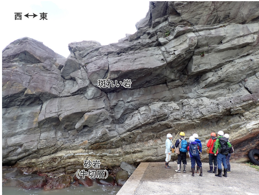
第6図 斑れい岩と砂岩(牛切層)の境界露頭(10月28日撮影)。露頭下部に牛切層, 上部に斑れい岩が露出する。斑れい岩の下部は細粒で, 急冷周縁相と解釈される。両者の境界はおおむね砂岩層の層理に平行であり, 斑れい岩は岩床(シル)と判断される。砂岩内部には斑れい岩の細脈が認められる部分がある。