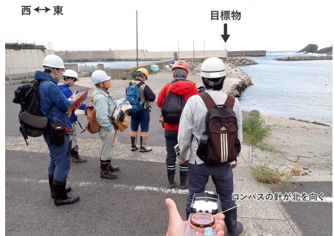
第2図 磁北方向を確認する様子(10月27日撮影)。小伊津漁港(三浦)において、磁北(西偏8度)方向に位置する赤色灯台(図中矢印)が、クリノメーター上で北を示すことを確認した。

参加者および講師は13時ごろに宿泊ホテルに集合しました。その後、小伊津漁港(三浦)へ移動して実習地の概要説明を行いました。最初に地磁気偏角について説明し、実習地の磁北方向(西偏約8度)に位置する対象物がクリノメーター上で北を示すことを確認しました(第2図)。続いて、漁港東部に分布する成相寺層、牛切層およびそれを貫く斑れい岩岩床の露頭調査を行い(第3図)、岩相観察や層理面の走向傾斜の測定などを実施しました。岩相観察では、砂岩・泥岩・斑れい岩の判別の着眼点や、熱変成を受けた砂岩・泥岩について説明を行いました。走向傾斜の測定で