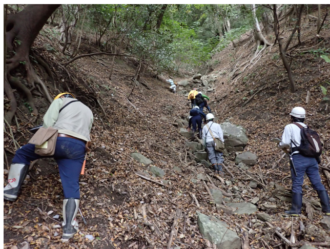
第 13 図 矢代岳東部の沢沿い踏査の様子 (10 月 30 日撮影)。クリープした露頭の判別、浮石や落石に対する安全管理など、急斜面での調査方法について学習した。講師と講師補佐が先頭・最後尾を担当し、足場の補助や荷物の分担を行うなど、参加者の負担軽減と安全確保に十分配慮して実施した。

三津集落北東部の道路沿いから菅沢集落南方の沢沿いにかけての調査を行い、成相寺層の泥岩とそれに挟まる礫岩や火砕流堆積物を観察しました。この調査においては、砂岩層上下面の岩相変化から上下関係の判定方法、火砕流堆積物の同定方法、火砕流堆積物中に含まれる軽石の特徴などについての説明を行いました。