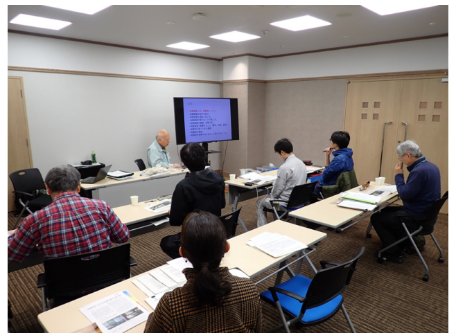
第5図 室内研修の様子（10月27日撮影）。室内研修には宿泊先ホテルの会議室を利用し、初日は地質学および地質調査の基礎について講義が行われた。本写真に写るスライドには「地質調査とは。地質図について。」と題した目次が表示されている。