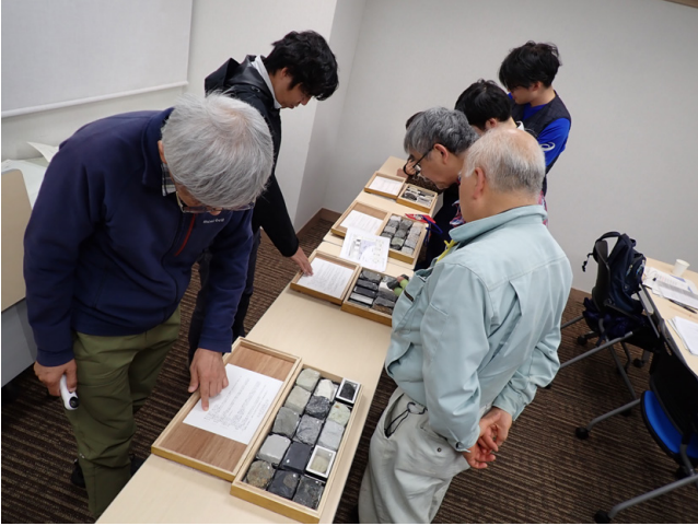
第 9 図 岩石標本観察の様子（10 月 28 日撮影）。堆積岩・火成岩・変成岩・火山噴出物の各試料を観察した。参加者はルーペを用いた観察や、スマートフォンによる検索を活用し、理解を深めていた。