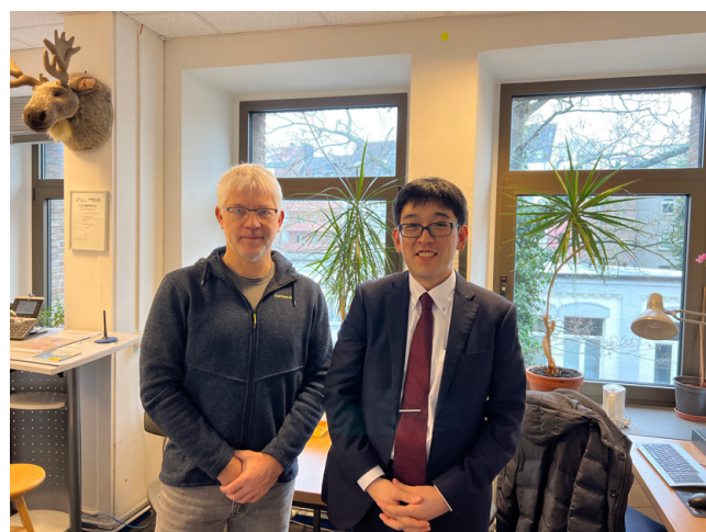
写真4 Schwarzbauer教授との記念写真(左: Schwarzbauer教授, 右: 筆者)