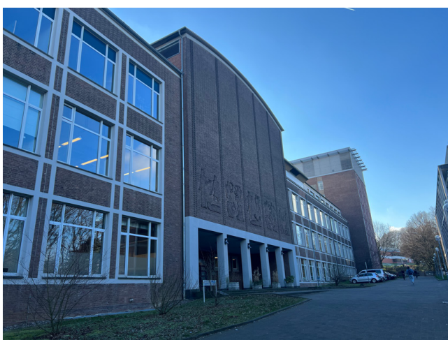
写真2 アーヘン工科大学