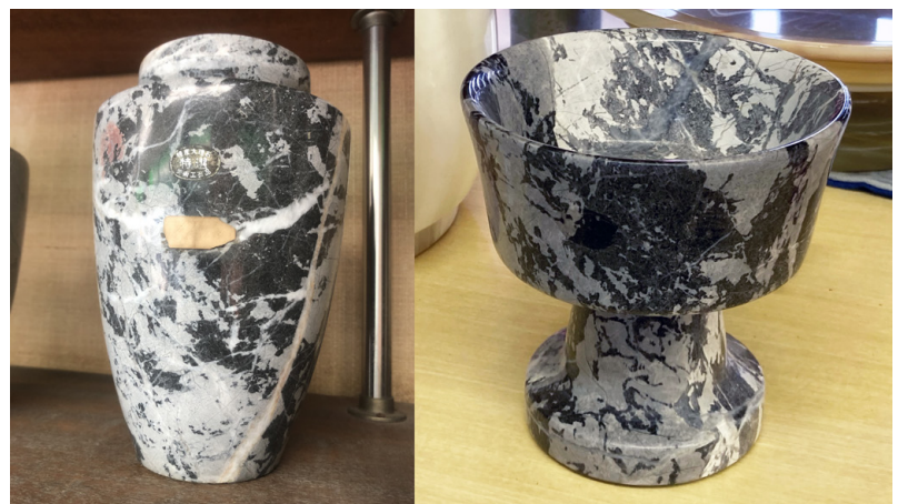
第4図 「山口更紗」を使用した工芸品. 「山口更紗」は花瓶(左)や盃(右), 文鎮などの工芸品に加工され, 秋吉台周辺のお土産店に陳列されているのをしばしばみかける.