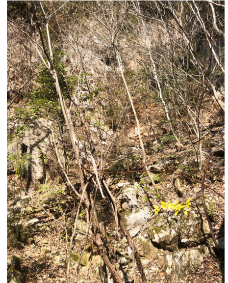
第2図 秋吉台北東部の「山口更紗」の採掘跡地. 1980年代まで小規模ながら採掘が行われていたが, 現在は採掘されておらず, 採掘跡地は木々に覆われている. 第6図の地点1.

秋吉台は石灰岩柱が林立するカルスト台地である. 山焼きにより草原となっている地域は特別天然記念物に指定され, 岩石の採取は禁止されている. マイクロコディウム石灰岩は秋吉台に広く分布するが, 「山口更紗」の採掘場は特別天然記念物地域外に位置する.