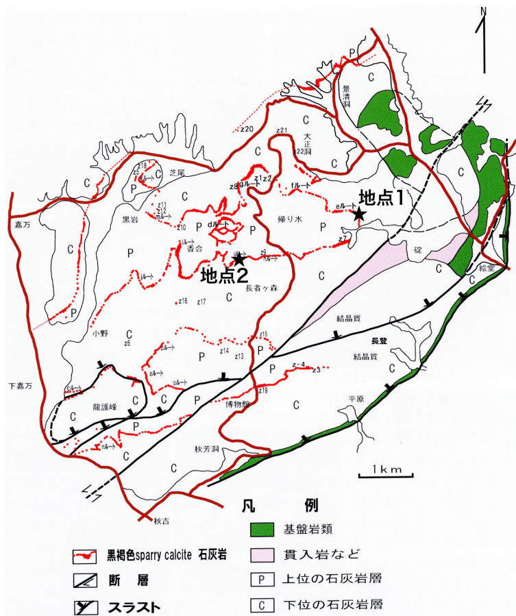
(右) 第6図 マイクロコディウム石灰岩の分布 (配川, 2008)。 マイクロコディウムは秋吉石灰岩では上部石炭系カシモビアン階にほぼ限定して産出し、野外での追跡により帯状の分布が確認されている。フズリナ化石層序により、マイクロコディウムの産出層準付近には比較的大きなハイエイタスがあることが明らかにされている (上野, 1989)。なお本図ではマイクロコディウム石灰岩は「黒褐色 sparry calcite 石灰岩」として赤帯で分布が示されている。