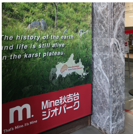
第3図 美祢市立秋吉台科学博物館の入口付近の柱の装飾材に使用される「山口更紗」. 博物館内にはこのほかにも各所にさまざまな秋吉産大理石石材が使用されている.