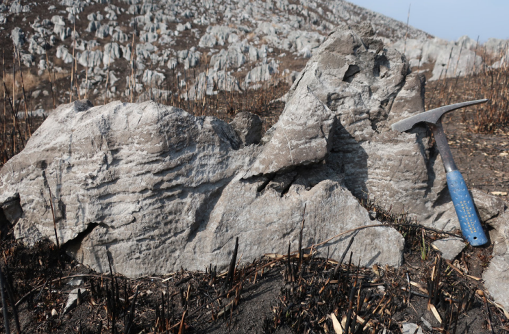
(上) 第5図 マイクロコディウム石灰岩の露頭での産状。 マイクロコディウムは褐色を呈することから野外でも比較的認識しやすい。ここでは層状に発達する様子が観察される。第6図の地点2。