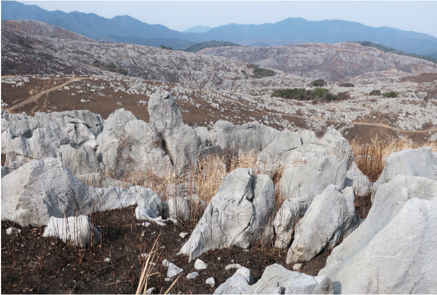
第1図 秋吉台の風景.

山口県美祢市の秋吉石灰岩から採掘された大理石石材の銘柄は数多くあるが(中澤ほか, 2016), なかでも異色な大理石として, 灰白色と黒褐色がまだらに入り混じる模様の「山口更紗」が知られる. この模様の黒褐色部分はマイクロコディウムと呼ばれる炭酸塩組織からなる. マイクロコディウムは土壌形成に伴い生成されると考えられており, 陸上露出を介することから, 当時の海水準変動の復元や古環境解析においても重要な組織である.