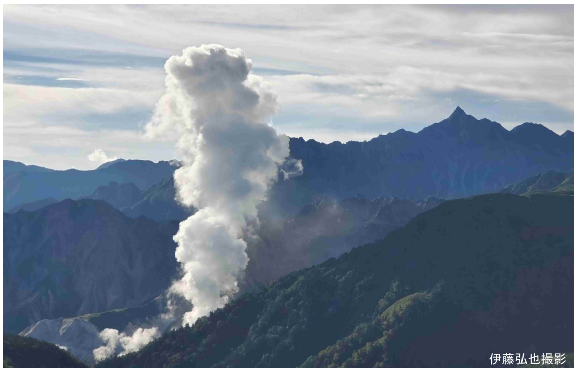
口絵2 槍ヶ岳より高く上がる噴気(8月31日7時過ぎ)。