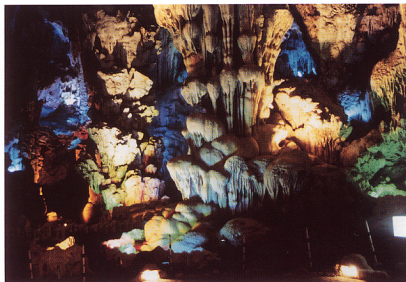
7. 鍾乳洞には遊歩道や色彩豊かな照明が整備されている。