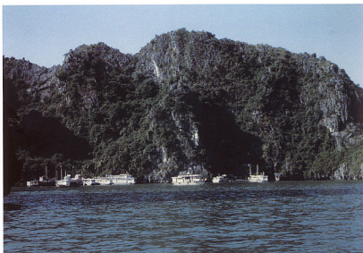
6. 入江に集まった観光船。うしろの山の中に鍾乳洞があり、観光客はここで船を下りて、30分ほどの地底探検を楽しむ。