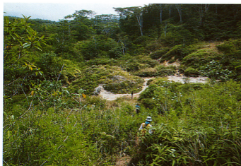
7.マタロコ地域の全景。基本的には噴気地帯で、95℃の河川水と混合した酸性硫酸塩温泉や「溺れた噴気」が存在する。酸性変質と地すべりのため地形的に低くなっている。