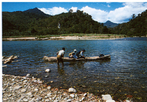
6.ワイベシ地域に行くために、Wai Pesi川を渡る丸木舟。ワイベシ地域は右手奥から合流するWai Naong川の上流約2kmにある、75～90℃の塩化物泉が存在している。