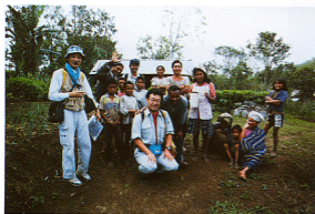
9.マタロコ地域調査後付近の村人に「モケ」という椰子酒を飲ませてもらう。続けて2杯飲むのが礼儀である(撮影：浦井、本文参照)。