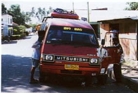
10.レンバータ島で借りた小型レンタバス。レンバータ、アロール、チモール等、NTT州東部では小型レンタバスがとても道路とは思えない「小径」にでも乗り入れてくれる。レンタバスに乗っているときは少々怖い調査は非常に楽である。