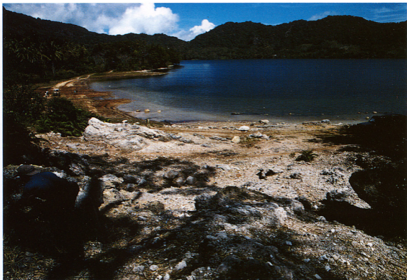
4.ワイサノ地域、奥手にワイサノの火口湖、手前側にシリカシンターが見える、左手の自動車の奥に、40～85℃の温泉が存在している(口絵5に続く)。