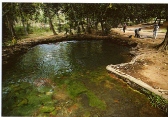
8.メンゲルータ地域に湧出する40℃の酸性硫酸塩温泉の湧出口。湧出量は24トン/分、典型的なラテラルフローによる温泉である。