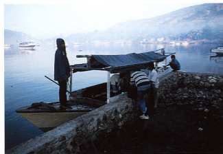
13. ワイリアンからカラバヒまで備船した「舟」、川舟くらいの大きさしかない、ワイラングを午後7時40分に出発し、カラバヒに到着したのは翌朝6時30分であった(本文参照)。