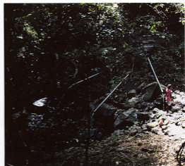
12. カランゴラ火山観測所の南西方にあるワイウエジャックの40℃の炭酸塩泉(ワトゥクバ地域)、標高はアテダグの噴気地帯より600m下位である。