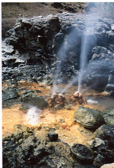
14. プカピティン地域の塩化物泉(沸点)、シンターの先から景気良く吹き上げている。地化学温度計は150~160℃を示し、案に相違して低かった。