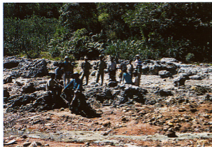
5.ワイサノ地域の温泉、85℃の高濃度塩化物泉が人々が集まっているシンター堆積物付近から湧出している。手前にはさらに奥手から流出する45℃の塩化物-硫酸塩泉が川になって流れている。