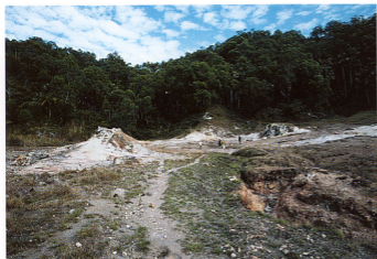
11. カランゴラ火山観測所の南方にあるアテダグの噴気地帯(ワトゥクバ地域)、噴気温度は沸点であるが硫化水素臭などは一切しなかった。