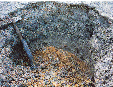
5.b火口列近くでの噴火堆積物の断面：堆積物ここでの厚さは27cm。茶色く見えるのが旧地。下から細粒火山灰(5cm), 礫混じり粗粒火山灰(5cm), 淡灰色火山灰(2cm), 火山礫層(雨による。次堆積物?, 5cm), 粗粒火山灰(2cm)と重なる。礫は径数mm-数cmで変質岩からなる。軽やスコリアなどマグマに直接由来する本質物質含まれていない。