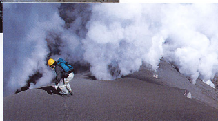
4.西側地表から見た火口列：人物の左側がb火口列の東端, 右側へc1, c2, c3, c4の各火口列が見える。d火口とe火口はc4火口列の向こう側で見えない。人物の足下は, 今回の噴出物に厚く(このあたりで30cm程度)覆われている。