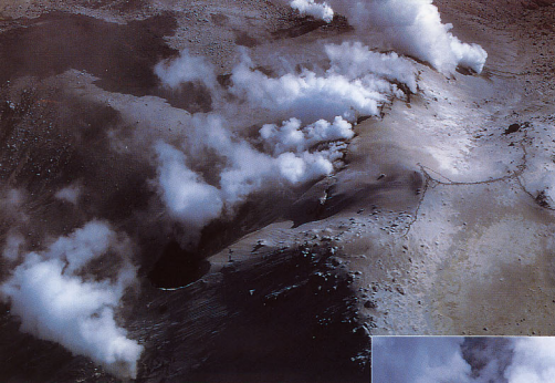
3.西側からみた割れ目火口列：火口列は左下から右上へa1火口(白煙をあげている), a2火口(直径30m, 噴煙弱い), b火口列(一番手前は活動を停止), c1, c2, c3, c4の各火口列(雁行状に縦に並ぶ), d火口(噴煙多い)そしてe火口(火口の回りが濡れている)。これらの配列からやや離れて写真中央上端にa3火口。(10月18日9時に撮影)