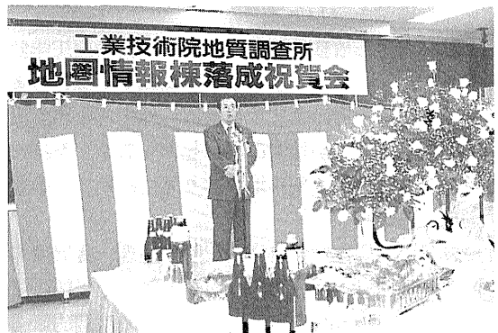
写真2 祝賀会における平石工業技術院長の挨拶