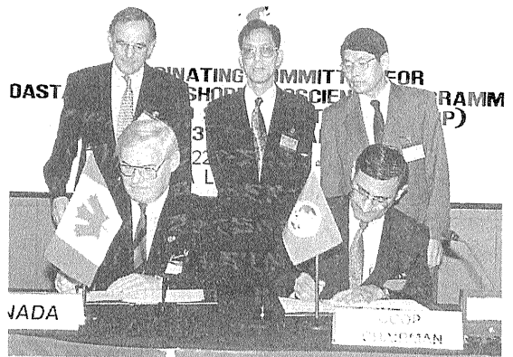
写真2 カナダと CCOP との間の協力覚書(MOU)調印式。