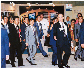
3. 展示会場で皇太子殿下をご案内する渡部通産大臣と石原工業技術院長(地質調査所前所長、IGC事務総長)。