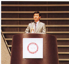
1. 開会を宣言される皇太子殿下。

8月24日から9月3日まで、京都市の国立京都国際会館で、90カ国から4,277人が参加して第29回万国地質学会議(IGC)が開催された。24日の開会式では、名誉総裁の皇太子殿下が開幕を宣言され、政府を代表して渡部通商産業大臣が挨拶された。