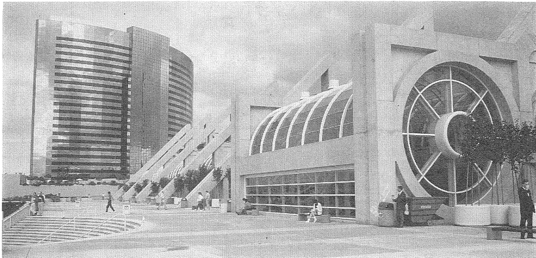
写真2 GSA の年会が行われたサンディエゴ コンベンションセンターの外観。左後方は Marriott ホテル。