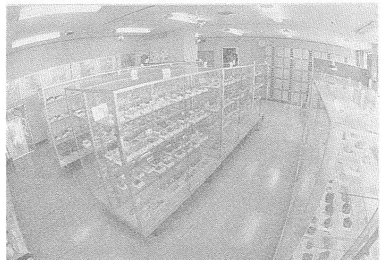
写真2 標本室の内部 最近、標本の保管分が鋼鉄製の引出しに格納された。