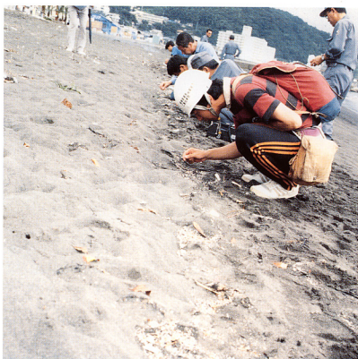
口絵5 伊東市松原地区の海岸に漂着した噴出物。海岸は黒色砂礫浜なので、白色-灰白色の軽石はよく目立ちました。7月14日撮影。