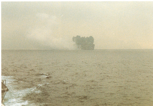
口絵4 「拓洋」から見た噴火。(本文参照)