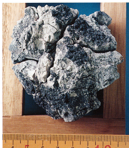
口絵7 手石島対岸の沙吹崎沖で海面に浮遊していたパン皮状火山弾。T. V. 取材活動中のダイバーが採取したもの。表面には黒色玄武岩が付着しており、発泡による体積膨張時にできた独特の割れ目が認められます。