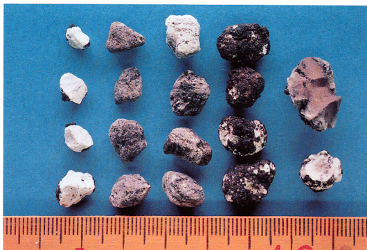
口絵6 採取された軽石片。左から、白色軽石、灰色軽石、楕状軽石、黒色玄武岩に“チョコレート”状に覆われた軽石、累帯構造を示す軽石。岩石学的検討により、今回の噴火をもたらした犯人は“シロ”ではなく、左から4番目の“クロ”であると判断されました。