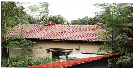
口絵2 地震で破壊された民家の屋根瓦。宇佐美地区。7月12日撮影。