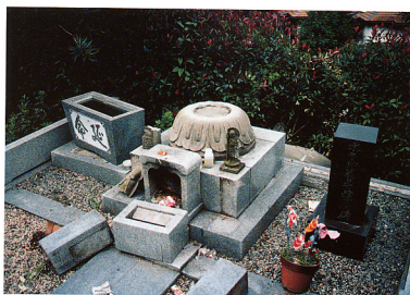
口絵1 地震によって倒壊した石像。台座の上にあった像は背後に落ちました。宇佐美地区。7月12日撮影。

た(写真5, 6)。漂着したことから単純に類推できるように, これらは確かによく発泡した軽石なのですが, 気泡が丸いこと, 変質鉱物が含まれていることなどから, この軽石が溶融マグマから直接もたらされたものとは考えにくいことが明らかになりました。そしてむしろ一部の軽石の周囲に付着している黒色玄武岩の方が今回の噴火活動をもたらしたマグマが冷え固まったものだと推定されました。その後この考え方を支持する試料が提供されました(写真7-9)。漂着した軽石は海底下にあった古い軽石凝灰岩が, 玄武岩マグマの熱により発泡してできた, 再生軽石だったのです。(本文p.14-26参照)