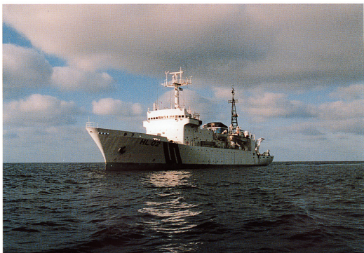
口絵3 7月13日の噴火現場直近で観測を続けた海上保安庁の測量船「拓洋」。