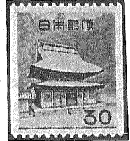
③ 最近のコイル切手 5円 10円 30円