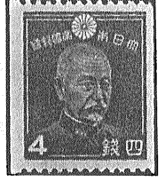
②戦前のコイル切手 ④田沢切手3銭 ⑤昭和切手5厘 4銭