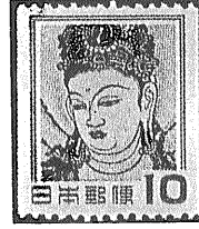
(1) 観音像切手 左 通常のもの 右 コイル切手