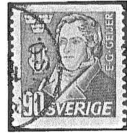
④ 外国コイル切手の例 2枚