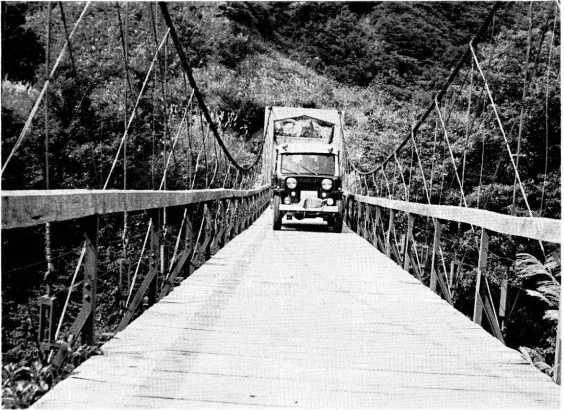
所内 第7回 写真コンクール 入選作 「重量制限1トン」 技術部 測量課 蔵山 功