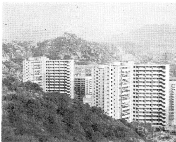
岩壁に 高層 住宅 に 建てられた アパート