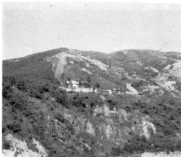
Needle Hill の タングステン 鉱山 全景