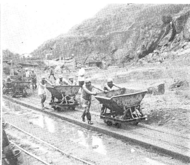
馬鞍山の 鉄 鉱 旧 露 天 掘 取 地 区 現 在 は 坑 道 採 掘 を 行 な っ て い す