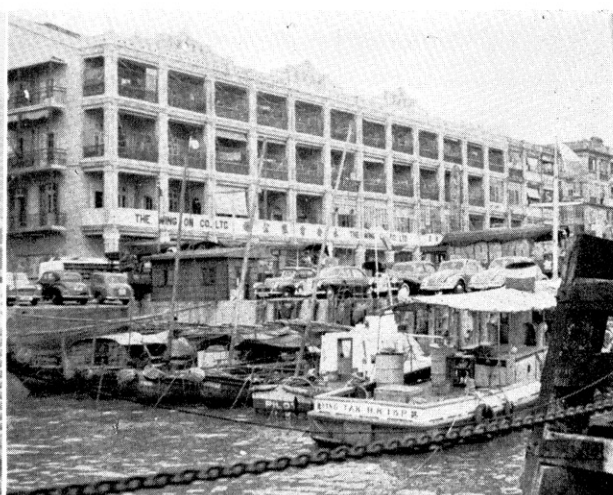
フェリー ボート で 香港 へ つく