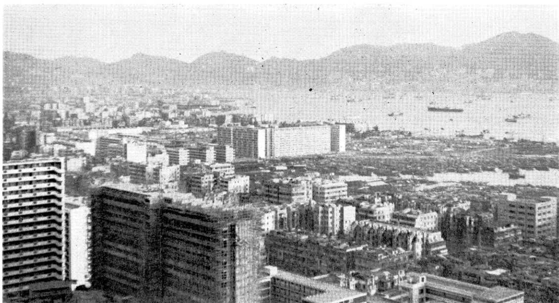
Kow loon から 香港 島 (香港 花崗岩) を 望む