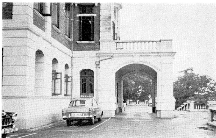
香 港 大 学 正 面 玄 関

文学部は 英文・支那文学・歴史学・経済社会科学・地理地質・哲学・近代言語学・教育学の各学科に分かれ これらに入学するには 英本国の規準試験に合格したもののみが許される。