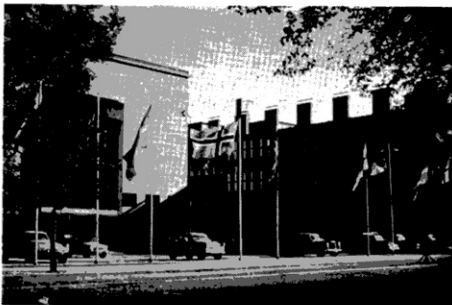
会 議 場

万国地質学会は誰でも所定の手続を済ませば個人の資格でも参加できるものである。しかしながら今回の会議の内容をみても国の代表として振舞わなければならないような事からもある。外国のむしろ多くの国々からの参加者は国の代表としての用意をもあらかじめ持って会議に臨んでいたように感じられた。