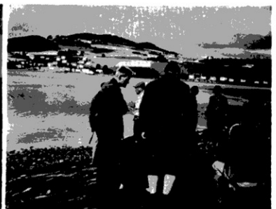
ノルウェー中部トロンハイム地方の地質見学旅行