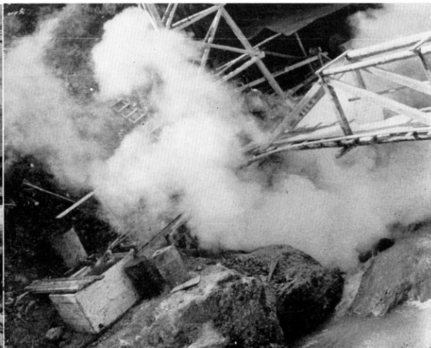
松川地熱地帯の7号井の天然蒸気の噴出