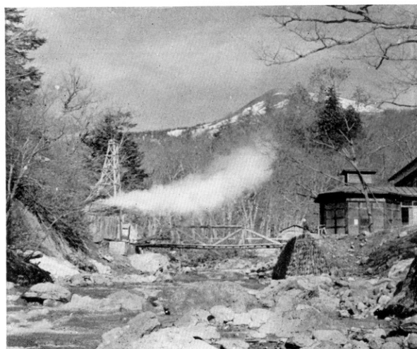
松川地熱地帯の天然蒸気 (赤川右岸7号井)