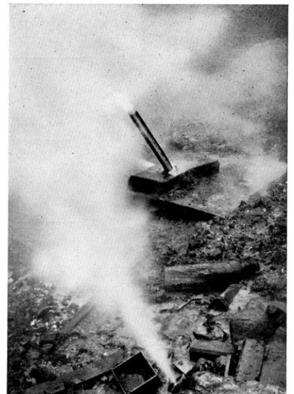
宮城県の鬼首吹上三尺におけるさく井の噴気 (利根ボーリング掘さく井)

盆地内の噴気・温泉活動は大きくみて 2つの区域に分けられる。1つは 荒雄硫黄山の噴気地帯で ここ