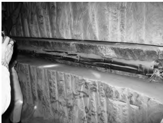
写真2 アッセ研究鉱山における岩塩の熱特性試験箇所。

のゴアレーベンが挙げられるが、現在も計画は凍結されたままであり、岩塩分布域以外の地層を含めたサイト選定手続きそのものの見直しが検討中である。なお、モルスレーベン処分場とアッセ研究鉱山は岩塩、コンラッド処分場は鉄鉱石が分布する。