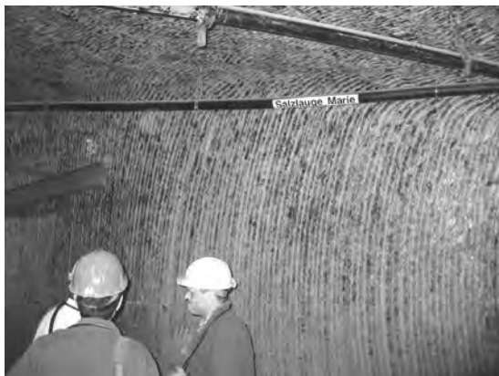
写真1 モルスレーベン処分場の坑道の状況。