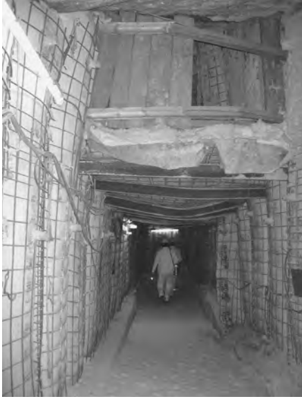
写真3 アッセ研究鉱山におけるクリーブ破壊した岩塩坑道。