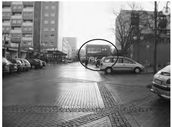
写真5 コンラッド処分場のインフォメーションセンター。

\text{m}^3/\text{day} の地下水が湧出しているとの説明を受けた。ただし、それ以外に坑内で観察された深部地下水は、15種類以上のトレーサー試験によっても、移動経路を把握できなかったとのことであった。