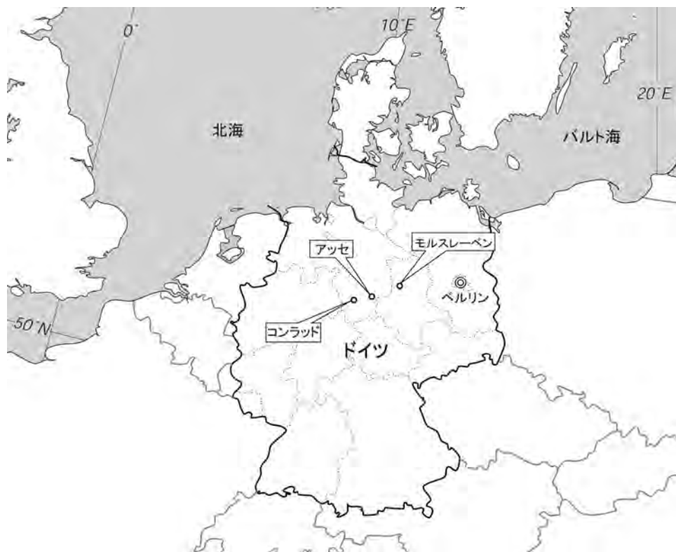
第1図 視察を行った放射性廃棄物の処分関連施設の位置。

層処分においては、天然の岩盤(天然バリア)と人工的なバリア(人工バリア)を組み合わせた多重バリアシステムによって、長期的な安全性が確保される(原子力発電環境整備機構, 2009)。地層処分における多重バリアシステムの信頼性をより向上させるためには、実際の地下空間における調査・研究を欠くことはできない。日本では日本原子力研究開発機構による瑞浪超深地層研究所(結晶質岩)と幌延深地層研究