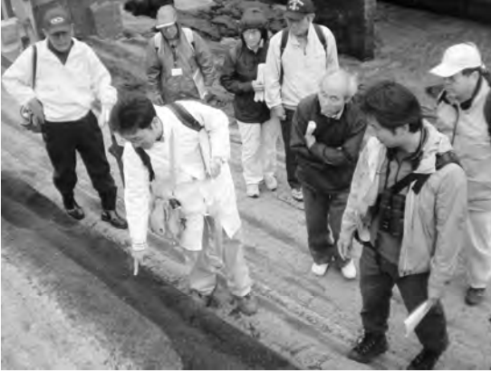
写真2 観察会の様子(2).