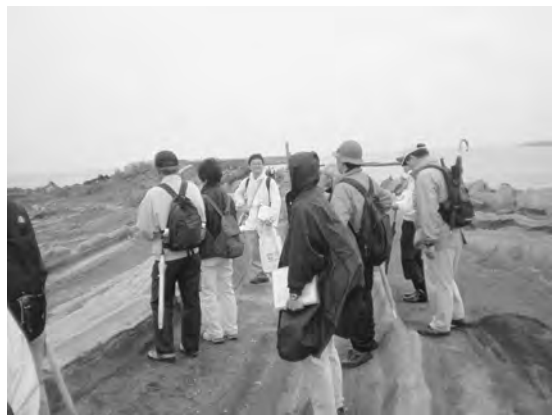
写真1 観察会の様子(1)。

観察会は三浦半島の西側から東側に向かって、南側の岩場を歩きながら行われました(写真1, 2)。はじめに地層の走向と傾斜、上下判定、岩相、断層など、地層観察の基礎を解説しました。それらの基礎に基づき、三崎層に認められるスランプやスラストによ