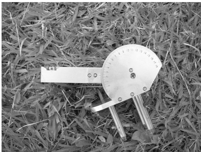
第2図 3本脚クリノメータ (側方から見た様子)。

然残留磁化, それがつくる磁気異常, それらの磁氣的性質に基づいた地球科学の研究(例: 古地球磁場変動の復元, 大陸と海洋のテクトニクス, マグマの起源)が新しいステージに入っていく予感を持っています。研究対象は, 地球だけではなく(例えば, 月の進化を探る日本の衛星による月の磁場観測は, この原稿が出る頃には既に始まっていることでしょう)。そして, そのような研究を行いたい私の地質調査は, 地質の基本的性質をまとめた図* 脚注 (陸・海の地質図幅, 火山地質図, 磁気異常図, 重力異常図, 地球化学図, 等), さまざま論文・報告書を調べるところ