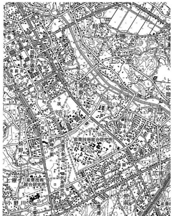
第2図 つくば研究学園都市南部の地形図(日本地図センター(1996a)から一部抜粋)。