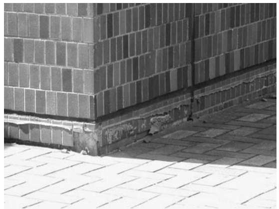
第4図 産業技術総合研究所共用講堂の外壁に認められる抜け上がり. 外壁の下から10cm程度のところに, 当初の地表面(敷石面)の名残が認められる. 現在は敷石面の方が10cm程度地盤沈下しているが, 建物の方は支持基盤があるので沈下することなく相対的に盛り上がったかのように見える.