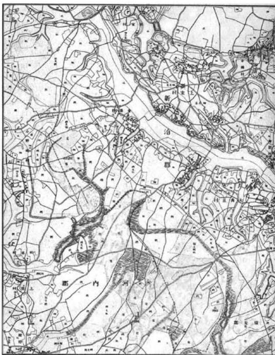
第1図 第2図と同じ範囲の明治時代の地形図(日本地図センター(1996b)から一部抜粋)。

に適応した自然環境を介して自然を体験し実感することが、極めて重要であることを強調したいと思います。つくば市は東京などと比較すると、周辺地域に昔ながらの自然が残っています。また、中心部には多くの緑地が公園として残されています。いわば人口密集地ではなく、田園地域に設計された街です。それゆえ、意識すれば、多くの自然を見出すことができます。以下、その特徴を周辺部の既存の集落と比較しながら記述し、最後に豊かな自然観を育むための方策を提案します。