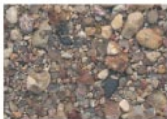
No.2078 近江八幡市・宮ヶ浜水泳場