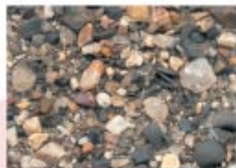
No.2085 びわ町・早崎港南湖岸