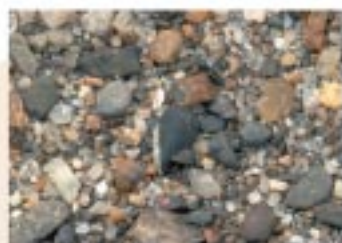
No.2083 彦根市・松原水泳場