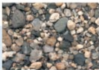
No.2093 今津町・今津浜水泳場