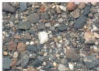
No.2085 びわ町・南浜水泳場