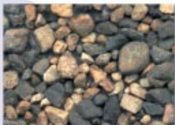
No.2089 木之本町・西端湖岸