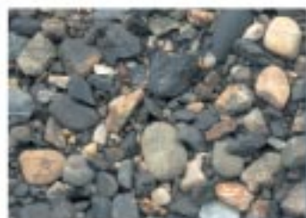
No.2094 今津町・石田川河口