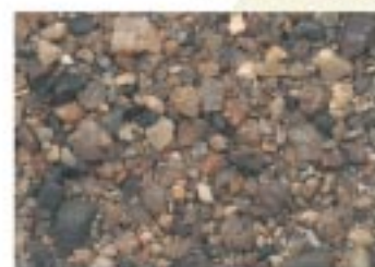
No.2075 草津市・水質浄化センター 南側公園

画像は、左右 2.82cm、上下 2.0cm の範囲を画像化したもので、約 1,100 万画素のデジタル画像として保存されています。