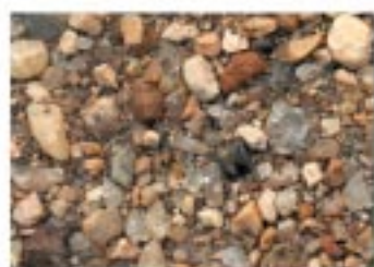
No.2099 高島町・萩の洪水泳場