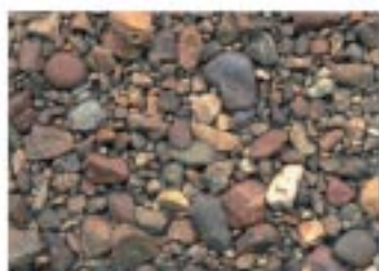
No.2088 余呉町・余呉湖西岸