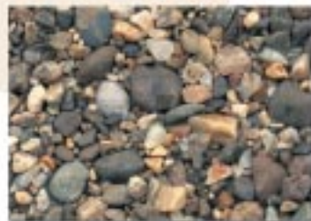
No.2081 彦根市・芹川河口右岸