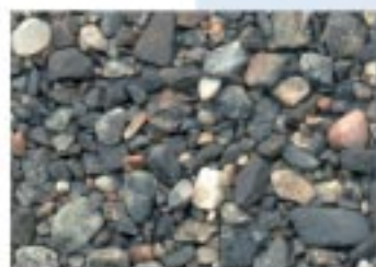
No.2098 安曇川町・安曇川河口2