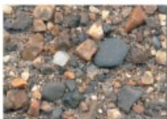
No.2079 彦根市・新海湖岸公園