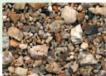
No.2100 志賀町・北小松湖畔