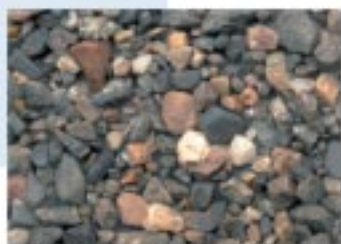
No.2095 新旭町・針江湖畔