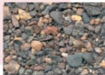
No.2084 長浜市・長浜ドーム前