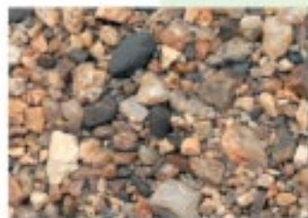
No.2102 大津市・琵琶湖大橋西