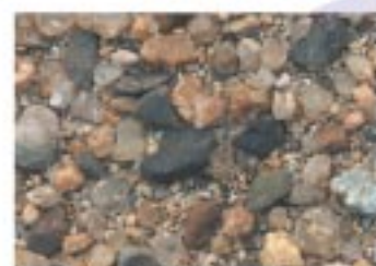
No.2092 マキノ町・西浜湖畔