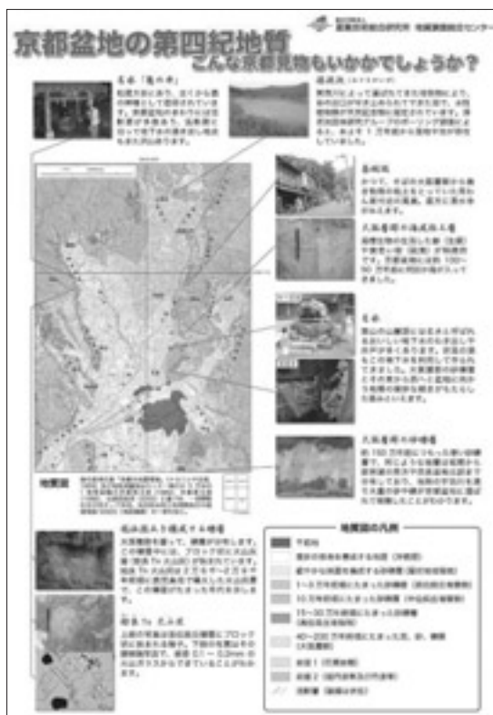
第1図 地質情報展展示ポスター「こんな京都見物もいかがでしょうか?」(口絵8頁)。

大阪層群 大阪層群は鮮新世から更新世に堆積した川や湖の堆積物で、京都盆地では数枚の海成粘土層や多くの火山灰層を含む。河川成の厚い砂礫層や海成粘土層の写真を展示した。また、湖などにたまった粘土層は焼き物の原料としても利用されてきた。清水寺へ向かう途中の茶碗坂付近ではかつてこのよう