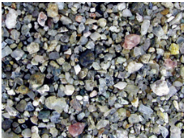
4. 新潟県新発田市, 加治川(新潟60034).