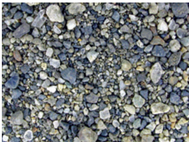
5. 群馬県東村, 渡良瀬川(宇都宮51037).