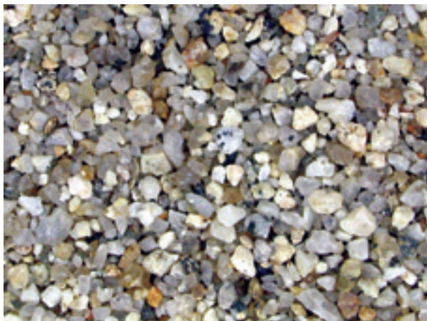
7. 岐阜県上矢作町, 上村川(豊橋35035).