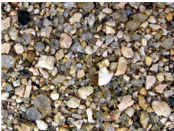
10. 広島県大竹市, 小瀬川(広島22005).