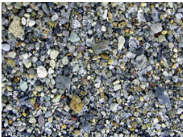
2. 青森県平賀町, 浅瀬石川(弘前73025).