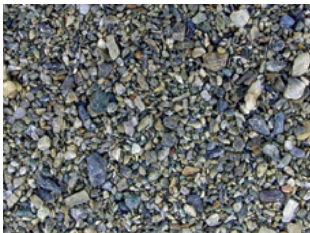
9. 徳島県山川町, 川田川(徳島24006).