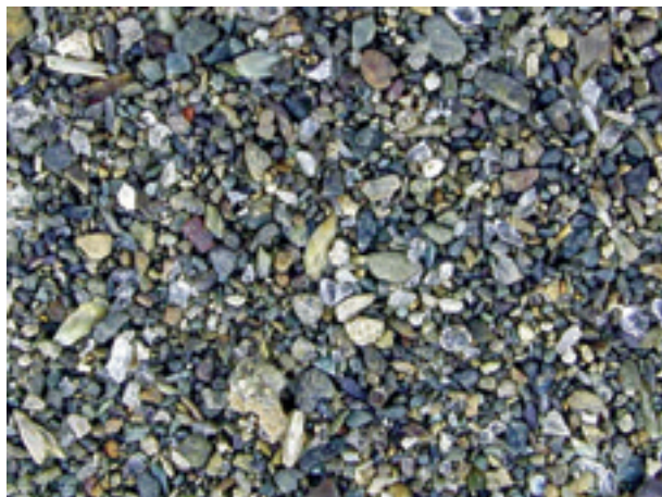
1. 北海道美瑛町, オイチャンヌンベ川(旭川92014).

日本の地球化学図の作成に用いられた、河川堆積物試料の画像を示す(本文37ページ参照)。画像の左右が約4.2 cm。( )内は試料番号。