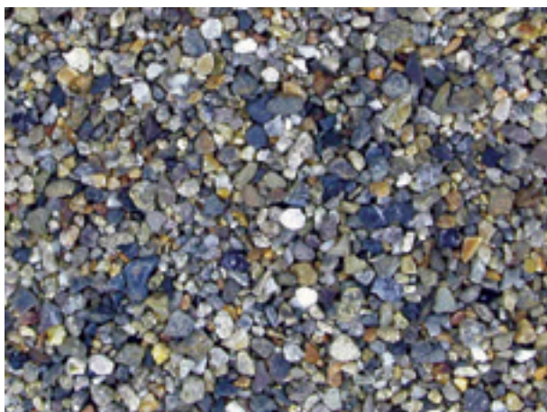
11. 宮崎県日之影町, 日之影川(大分09053).