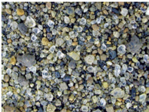
3. 宮城県大和町, 吉田川(仙台64030).