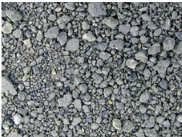
8. 大阪府大阪市, 神崎川(京都及大阪33006).