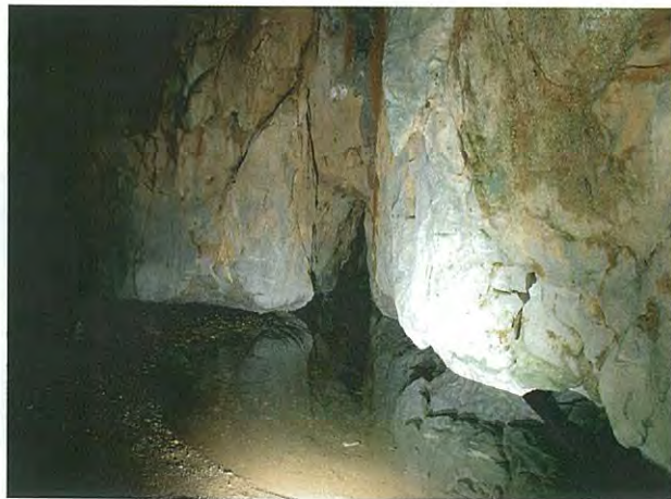
5. 阿曾の風穴. 管理洞としての最奥部は水没していますが、洞窟はさらに奥に続いています. 写真の横幅は5m前後です.