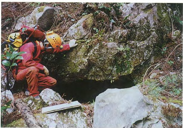
6. 稲森の横穴. 洞口は狭く、覗いても中は真っ暗です.