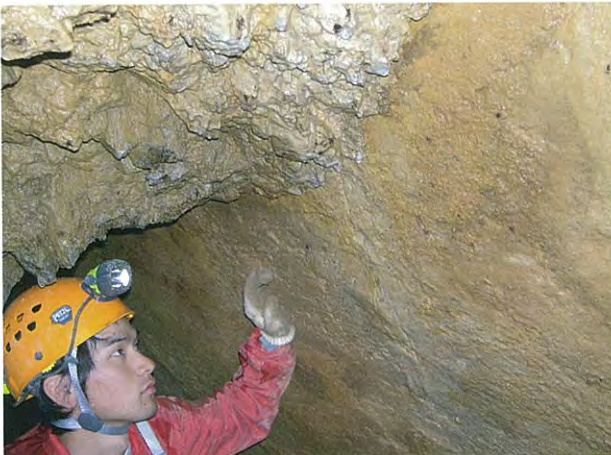
2. 藤ヶ野の穴の断層洞窟の断層破碎帯と鏡肌を持つ断面。がさがした見かけの破碎帯と、つるつるした鏡肌が対照的です。