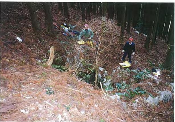
8. 大柄の縦穴. 植林斜面に洞口が開口しています. 近くの木にロープを固定して、専用の装備を身に付けて、慎重に降ります.