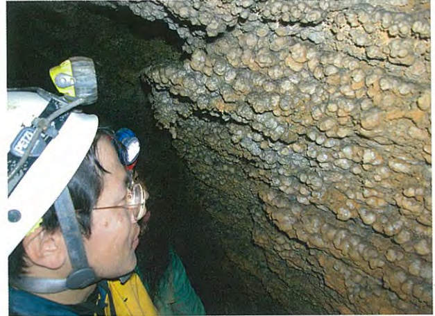
3. 藤ヶ野の穴の二次生成物。ポップコーン状の洞窟珊瑚をたくさん見ることができます。