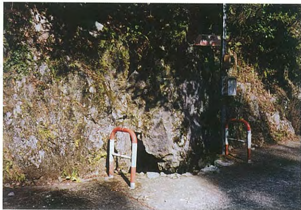
4. 阿曾の風穴. 洞口は車道沿いに開口しています.