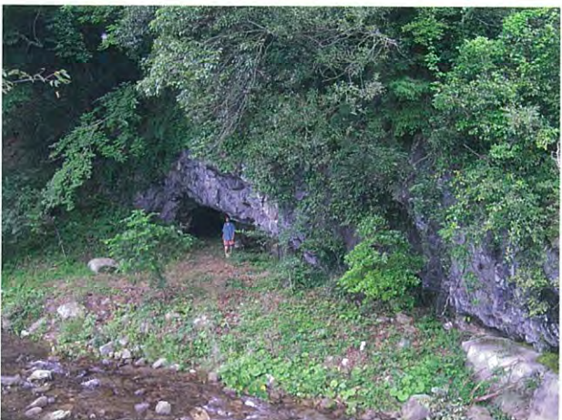
9. 木屋のコウモリ穴. 車道から見た風景です. 人の立っている所に、ひときわ真っ黒な部分がありますが、そこがコウモリ穴への洞口です.