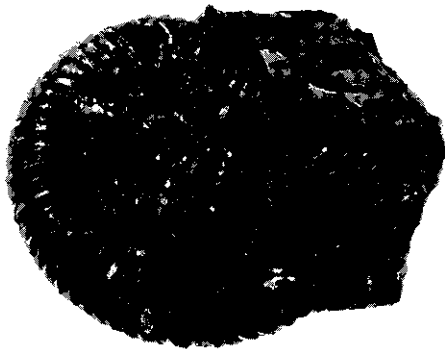
第1図 化石レプリカの原標本となったアンモナイト Mesopuzosia pacifica Matsumoto (GSJ F8546), 直径約7cm.