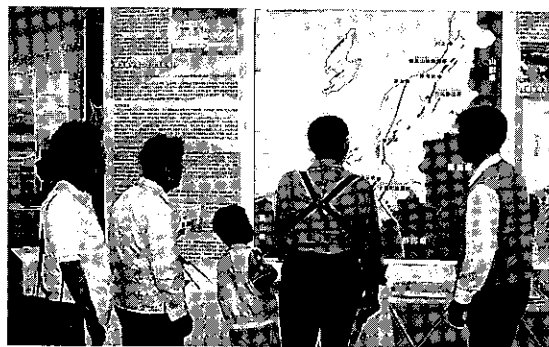
写真1 会場での活断層ポスター。

魚沼丘陵南部の丘陵東西両側に活断層があります。魚野川が流れる五日市盆地側には石打断層が