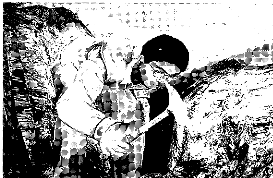
第1図 ゲームに含まれる露頭調査(地表地質調査)の説明アニメのシーン。

このゲームの所々で、探査手法の技術説明アニメが見られるようになっていて、露頭調査の説明では、ハンマーとクリノメーターを使って地質調査法が解説されている。露頭写真を撮る時に、ハンマーをスケールとして置くことなど、細かいところまで、現実の調査作業の様子を見せてくれる。このような作業は、実際に三菱マテリアル資源開発の職員の動きからコンピューター画像を作成したとのことで、