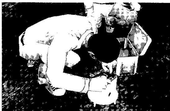
第2図 重力探査の説明アニメのシーン。