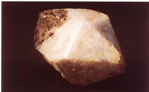
2. 粘土層の基底部から発見された巨大な水晶。長さ45cm、直径35cmの大型水晶。左側基部の黒水晶を覆うように白水晶が成長している。黒い部分は340℃程度、白い部分は225-245℃程度と、異なる条件下で結晶成長している(Mizota et al, 1998, 中山ほか, 1997)。鳥根大学の中山勝博先生により採取され、地質展で展示したあと、地質標本館に寄贈された(登録番号: GSJM34841)。