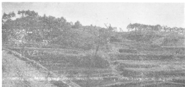
図版 6 佐用礫層を望む (図幅