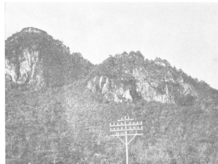
(図幅地域南縁中央部佐用町岡にて)

流紋岩凝灰岩～凝灰角礫岩は変質安山岩凝灰岩～凝灰角礫岩・凝灰岩質砂岩～頁岩・変質安山岩およびその他の古期岩層を被覆して、一般に流紋岩よりも下位にあるが、まれに流紋岩に挟まれて分布しており、ときに走向・傾斜を測定することができる。砂岩・頁岩ないし泥岩が本岩に挟まれることがある。図幅地域北東部小茅野西方の変質安山岩と流紋岩との境界付近では、流紋岩凝灰岩～凝灰角礫岩とその上に成層するシルト岩ないし頁岩は走向 N70° W、傾斜 20~30° S である。これによると変質安山