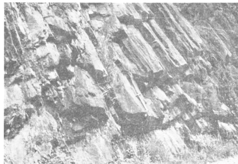
図版 3 流紋岩の節理（図幅地域西南部作東町宮原にて）

鏡下では、斑晶は主として石英・斜長石および黒雲母を交代した緑泥石からなる。石英は融蝕形を示し、斜長石は曹長石～灰曹長石である。アルカリ長石らしいものも見られることがある。長石は一部炭酸塩鉱物または絹雲母に交代され、ときに緑泥石に交代される。石基はときにガラス・絹雲母・石英・長石・緑泥石などからなり、ときに球顆状をなし、あるところでは石英(?)と長石とがオフィティック様組織を示し、ある場合には流状構造を呈する。