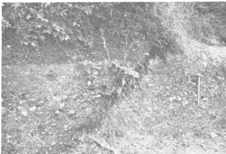
図版 4 川上層の礫岩 (図幅地域北西部大原町川上にて)