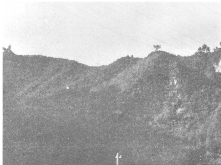
図版 2 流紋岩凝灰岩～凝灰角礫岩の崖を望む

が、輝石は緑泥石に交代されていることがあり、一部に淡褐色の黒雲母の微細片が見られることがある。石基は微粒の斜長石・輝石(?)・ガラス・鉄質物などからなる。