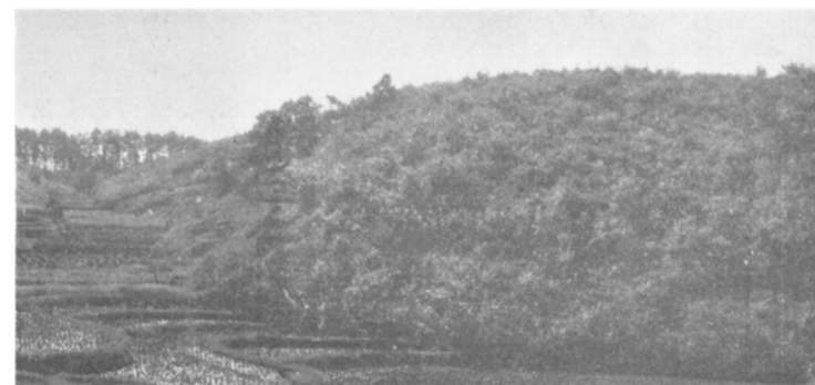
地域南西部佐用町にて)

沿革および現況 鉱山は相当古くから開発されていたようであるが、戦前帝国鉱産(株)により大規模に稼行され、相当出鉱したということであるが、終戦と同時に休山し