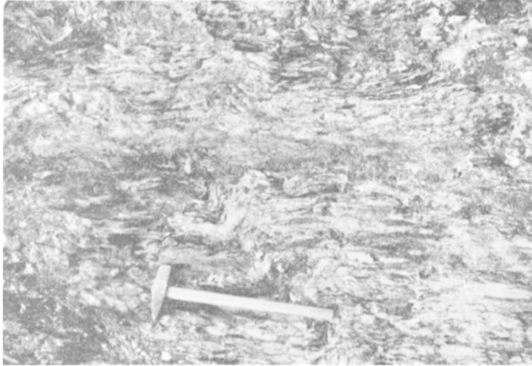
図版1 三郡変成岩中の千枚岩（図幅地域北西部勝田町豊成にて）

向はENE-WSWである。本岩類は微褶曲構造を呈することがあり、走向・傾斜とも変化に富んでいる（図版1参照）。