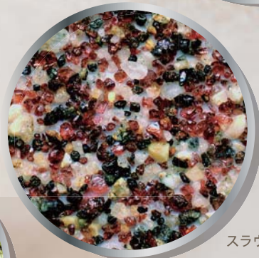
スラウェシ島の赤い砂

いろいろなきれいな砂について、実体顕微鏡で観察し、そういう砂がなにでできているのか、どうしてそういうきれいな砂ができるのか、について学習しましょう。記念に自分で砂のプレパラートを作成してお持ち帰りいただけます。