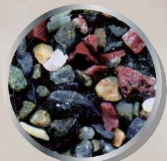
高知・五色浜の砂