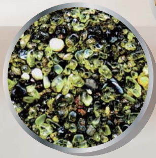
ハワイ島グリーン・ビーチの砂