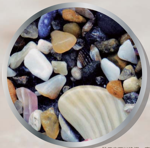
銚子市戸川漁港・東側の砂