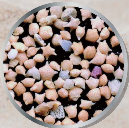
八重山列島・西表島の星砂

いろいろなきれいな砂について、実体顕微鏡で観察し、そういう砂がなにでできているのか、どうしてそういうきれいな砂ができるのか、について学習しましょう。記念に自分で砂のプレパラートを作成してお持ち帰りいただけます。